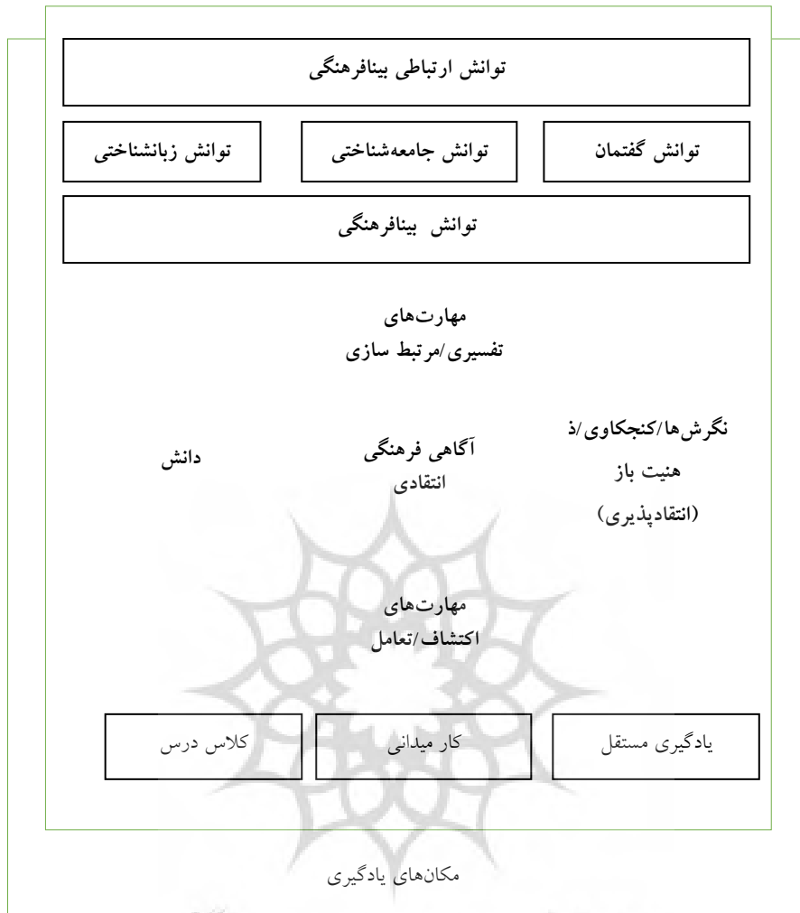
شکل (۱) مدل توانش ارتباطی بین‌فرهنگی (بایرام، ۲۰۰۹، ۳۲۳)

شکل (۱) عناصر تشکیل‌دهنده مدل توانش ارتباطی بین‌فرهنگی (بایرام، ۲۰۰۹، ۳۲۳) را نشان می‌دهد.