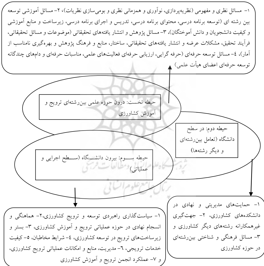
شکل (۲) - حیطه‌ها و مولفه‌های چندگانه و هم پیوند توسعه ترویج و آموزش کشاورزی به عنوان یک مورد بین رشته‌ای

این تحقیق کیفی که روش تئوری بنیانی و با هدف آسیب شناسی توسعه دوره‌های بین رشته‌ای در آموزش عالی کشاورزی بر پایه موردکاوی ترویج و آموزش کشاورزی صورت گرفت، به استخراج مجموعه‌ای از مسائل و مشکلات انجامید (شکل ۲).