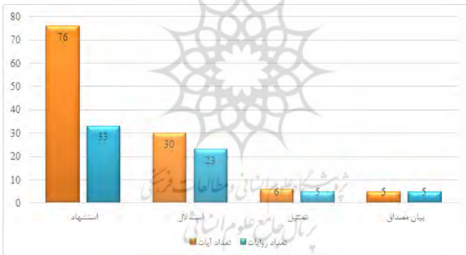
نمودار توزیع آیات در شرح روایات کتاب شرح چهل حدیث