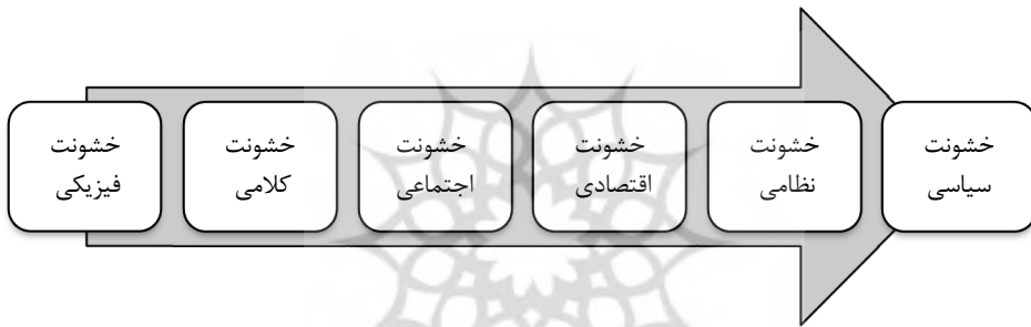
شکل شماره ۱: انواع خشونت از نظر انجمن مبارزه با آسیب‌های رفتاری

✓ خشونت سیاسی مبارزه از طریق سیاسی (انجمن مبارزه با آسیب‌های رفتاری، ۱۳۸۴: ۱۲).