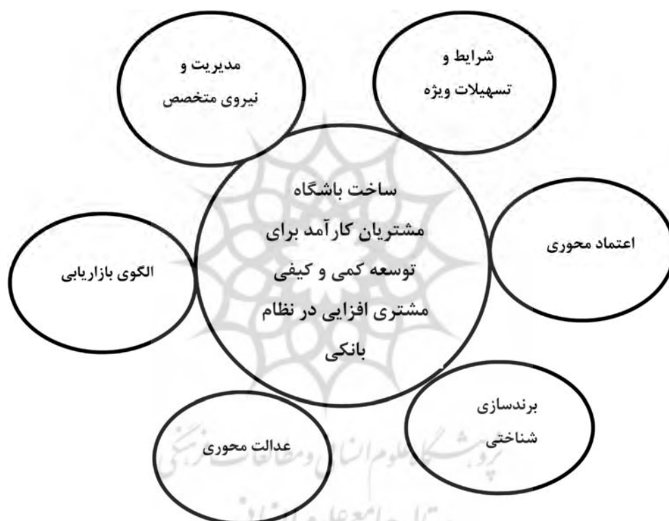
شکل ۱. مدل نهایی پژوهش برگرفته از بخش کیفی با روش شبکه مضامین

فرآیندها و تحلیل مضمون در نرم افزار تحلیل داده‌های کیفی MAXQDA انجام گردید. خروجی نهایی مؤلفه‌های استخراج شده به شکل زیر است: