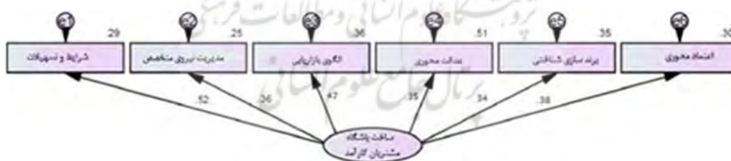
شکل ۲. الگوی مدل معادلات ساختاری

در ادامه به منظور بررسی اثر بخشی متغیرهای شناسایی شده و اثرات هر کدام از روش مدل معادلات ساختاری با استفاده از نرم افزار AMOS استفاده شد.