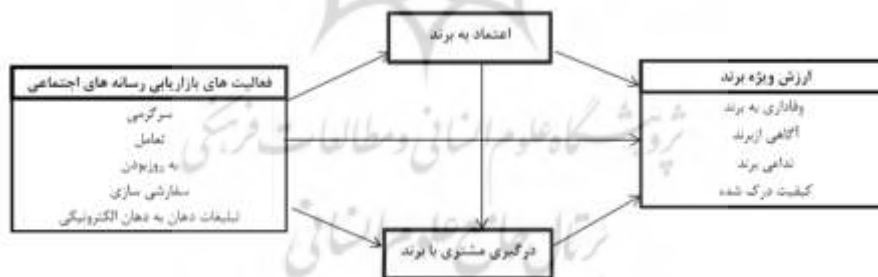
شکل ۱- مدل مفهومی پژوهش

مدل مفهومی پژوهش حاضر اقتباسی پیشینه های مطرح شده در حوزه بازاریابی رسانه های اجتماعی است که بر اساس آن ها نحوه ارتباط متغیرهای این تحقیق جهت تدوین فرضیه ها مشخص شده است: