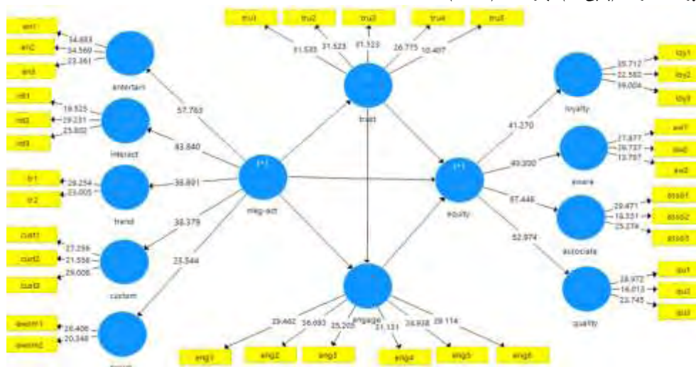
شکل (۳). مدل ساختاری در حالت معناداری

معیار بعدی در برازش مدل ساختاری از معیار معناداری t است. ضرایب معناداری، معنادار بودن تأثیر متغیرها و تأیید/عدم تأیید فرضیه‌های پژوهش را مشخص می‌سازد. مقادیر بالاتر از 1/96 در سطح معناداری 0/95 حاکی از تأثیر معنادار متغیرها می‌باشد. جدول زیر نمایش‌دهنده مدل حاوی ضرایب مسیر محاسبه شده است. حال با توجه به ضرایب استاندارد (شکل ۲) و آماره t (شکل ۳) به دست آمده از تجزیه و تحلیل نرم‌افزار PLS ، جدول بررسی فرضیه‌ها را می‌توان تشکیل داد.