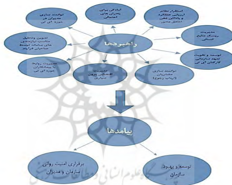
شکل ۲. راهبردها و پیامدهای مدیریت قدرت اوج‌گیرنده تئوکرات‌ها در سازمان بیمه سلامت ایران

با توجه به این که فلسفه وجودی تمام سازمان‌ها در بخش عمومی و خصوصاً سازمان بیمه سلامت ارائه خدمات به مردم است و خدمات در حوزه سلامت و بیمه سلامت هم از حساسیت بالایی برخوردار است و تمامی خدمات از بسترهای الکترونیک و از طریق سامانه‌های برخط ارائه می‌گردد؛ لذا هر گونه اختلال از نوع کندی و یا وقفه در بسترها و درگاه‌های مربوطه، کمیت و کیفیت خدمات به مردم را تحت تأثیر قرار می‌دهد.