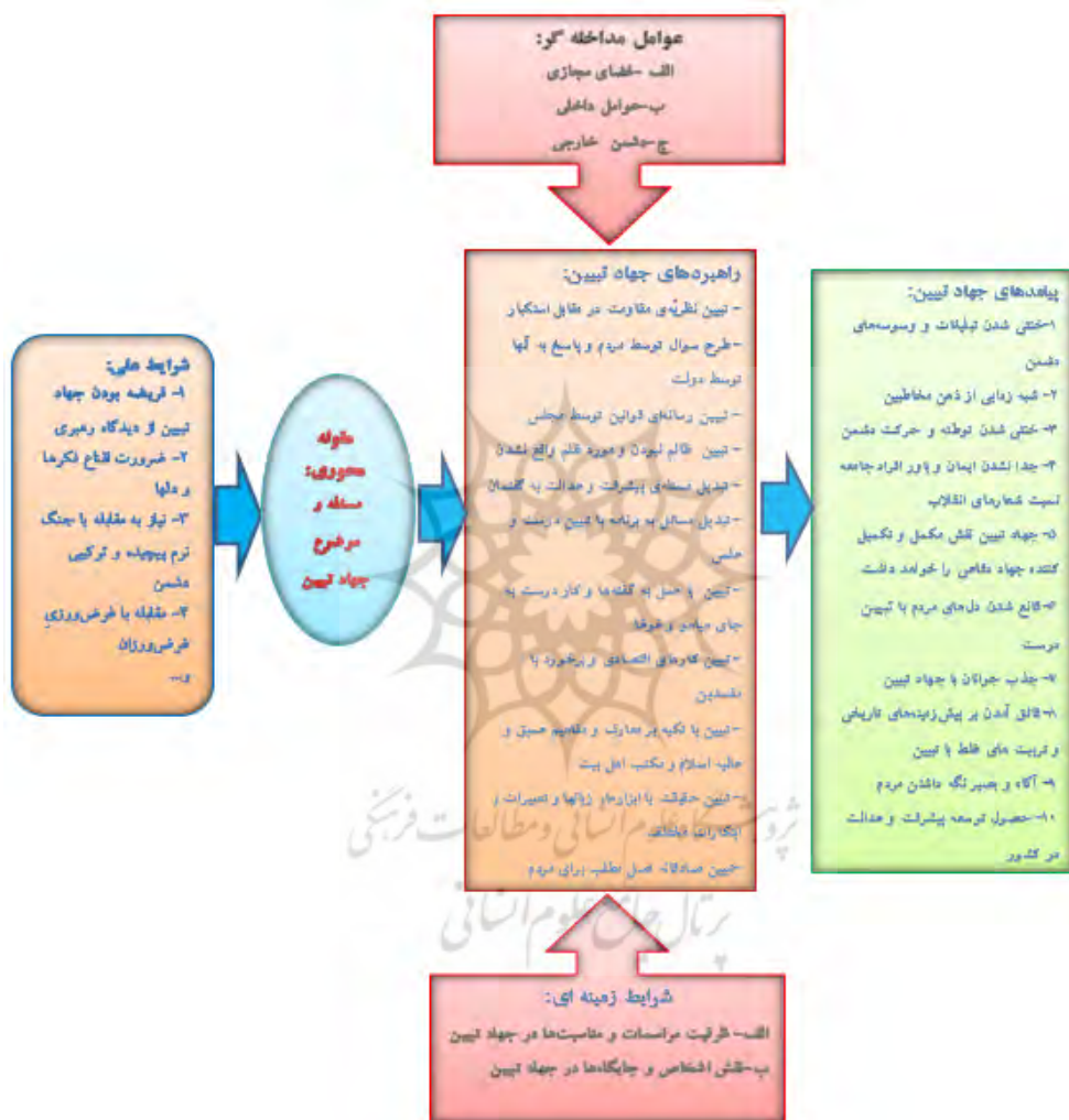
شکل شماره (۲): الگوی اندیشه فرماندهی معظم کل قوا (مدظله‌العالی) در خصوص جهاد تبیین