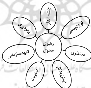
شکل شماره (۱): مؤلفه‌های رهبری معنوی محقق ساخته

احساس تصدی کاری مهم در سازمان و میان همکاران و احساس مسئول بودن و مشارکت در تصمیم‌گیری‌های سازمان است، رهبری معنوی در سازمان به کارکنان این احساس را می‌دهد که شغل آن‌ها از نظر سازمان و سایر همکاران دارای اهمیت است. چ (تعهدسازمانی: در تعهد سازمانی احساس هویت، وفاداری و وابستگی کارکنان به سازمان نمایان می‌شود، که فرد سازمان را معرف خود می‌داند و آرزوی باقی ماندن در آن را دارد. ح) بهره‌وری و بهبود مستمر: بهره‌وری به کار هوشمندانه تعبیر می‌شود، یعنی سازمان باید از منابع به گونه‌ی بهینه سود ببرد، رهبری معنوی با ارائه غیررسمی عملکرد روزانه کارکنان و همچنین بازدهی‌های رسمی دوره‌ای، برای افراد بازخورد فراهم می‌آورد، تا عملکرد خود را بهبود بخشند، نقاط قوت عملکرد خود را تقویت کرده و به کیفیت کار خویش توجه نمایند (پاملا و استفنی، ۲۰۱۶، ص ۶۷؛ جونا، ۲۰۱۹، ص ۲۰؛ خورشید، قلی‌زاده، ۱۳۹۵، ص ۵؛ سالارزهی و همکاران، ۱۳۹۸، ص ۸؛ شاوران و همکاران، ۱۳۹۷، ص ۴؛ شهبازی، ناظم، ۱۳۹۵، ص ۴؛ علامه، ناظم، ۱۳۹۶، ص ۴؛ غفاری، رستم‌نیا، ۱۳۹۶، ص ۵؛ نرومندمیاقی، ۱۳۹۶، ص ۳). با توجه به تحلیل مطالعات اکتشافی تحقیق مدل مفهومی پژوهش در شکل زیر نشان داده می‌شود.