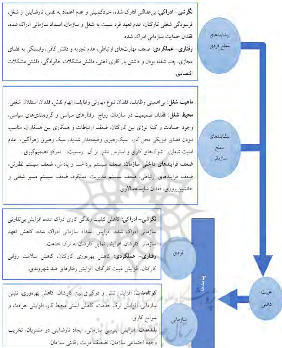
شکل ۳. الگوی پارادایمی غیبت ذهنی کارکنان در ایران