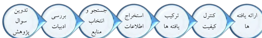
شکل ۱: مراحل فراترکیب