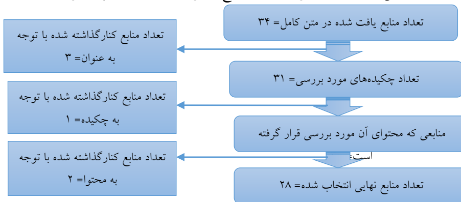
شکل ۲. فرایند ارزیابی و انتخاب منابع نهایی مورد استفاده در پژوهش

در مرحله چهارم نیز منابع منتخب با دقت بررسی و از این طریق پیشایندها و پیامدهای غیبت ذهنی کارکنان شناسایی و به عنوان کدهای اولیه استخراج گردید. جدول ۲، نمونه‌ای از نتایج حاصل از این مرحله از پژوهش را نشان می‌دهد.