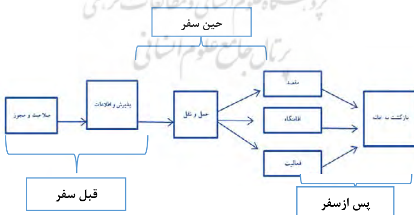
شکل ۱. فرآیند سفر تفریحی-گردشگری در ورزش

Janse van (2021) برای مدیریت سفر ورزشی برای ورزشکاران، مدلی از فرآیند سفر را تدوین کردند؛ که این فرآیند شامل سه مرحله (قبل، حین و بعد از سفر) بود. در همین راستا ایشی کاوا به‌عنوان پدر حلقه‌های کنترل و مدیریت کیفیت و رهبر جنبش کیفیت ژاپن و تدوین‌کننده استراتژی کیفیت ژاپن شناخته شده است. ایشی کاوا نمودار علت و معلول را مشابه سایر ابزارهای کیفی، وسیله‌ای برای کمک به گروه‌ها یا هسته‌های کنترل کیفیت در نهضت کیفیت می‌داند، به این ترتیب وی، ارتباطات باز کاری را برای درست کردن این نمودارها امری حیاتی می‌شمارد. از این رو، به منظور بررسی موضوع مذکور، مدل نهایی با اقتباس از مدل جنس ون و همکاران (۲۰۲۱) با بررسی پیشینه پژوهش و نمودار استخوان ماهی ایشی کاوا تدوین شد. در همین راستا این پژوهش به دنبال تحلیل موانع کیفیت گردشگری تفریحی - ورزشی بر اساس نمودار استخوان ماهی در استان گیلان است. لذا، سؤال اصلی تحقیق این است که ابعاد مؤثر بر کیفیت گردشگری ورزش استان گیلان شامل چه ابعادی است؟ و موانع کیفیت در هر کدام از ابعاد شامل چه مواردی است؟