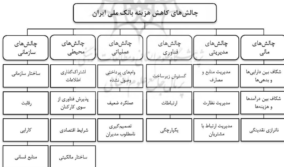
شکل ۲. ساختار سلسله مراتبی چالش‌های کاهش هزینه بانک ملی ایران

از معیارها را در راستای گزینه‌های رقیب جهت رتبه‌بندی آن‌ها مشخص می‌سازد. روش FAHP به‌گونه‌ای ماتریس‌های حاصل از مقایسات را با یکدیگر تلفیق می‌کند که تصمیم بهینه حاصل آید (آذر و فرجی، ۱۳۹۵). مراحل روش FAHP شامل ترسیم درخت سلسله مراتبی، تشکیل ماتریس‌های توافقی قضاوت، محاسبه وزن‌های اولیه، تعیین وزن نرمالیزه شده ماتریس‌ها و محاسبه اوزان نهایی است (زنجیرچی، ۱۳۹۰). ساختار سلسله مراتبی چالش‌های کاهش هزینه از دیدگاه مدیران و خبرگان بانک ملی ایران نیز در شکل ۲ آورده شده که با استفاده از سطوح هدف، معیار و زیرمعیارها ترسیم شده است. سپس با نظرسنجی از مدیران و خبرگان بانک برای هرکدام از این اجزا اعم از معیار و زیرمعیارها با استفاده از مقایسات زوجی، وزن‌دهی انجام می‌شود. پس از ترسیم درخت سلسله مراتبی، با استفاده از مجموعه‌ای از ماتریس‌ها، معیار یا زیرمعیار هر سطح نسبت به معیار یا زیرمعیار مربوط به خود در سطوح بالاتر به‌صورت دوجه‌دو (زوجی) و با بهره‌گیری از اعداد فازی مثلثی جهت تعیین اهمیت و ارجحیت بین دو عنصر تصمیم بر مبنای نظرات تصمیم‌گیرندگان (مدیران و خبرگان بانک)، ماتریس مقایسات زوجی تشکیل می‌شود. سپس میزان سازگاری و یا عدم سازگاری ماتریس مقایسات زوجی محاسبه و در صورت سازگاری ماتریس مقایسات زوجی، وزن نهایی معیارها و زیرمعیارها تعیین می‌شود.