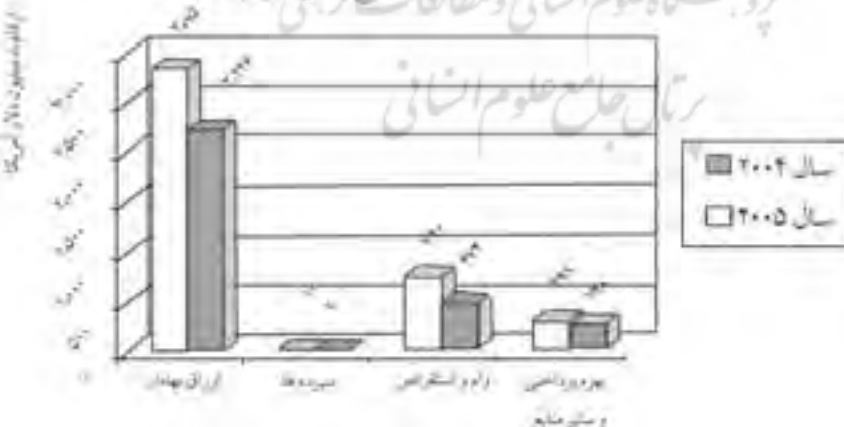
نمودار شماره یک - ترکیب منابع بدهی اگزیم بانک هند

استقراض: یکی از منابع مهم این بانک استقراض می باشد. منابع استقراضی این بانک عبارتند از: بانک مرکزی، دولت و موسسات مالی خارجی. مبلغ استقراض هم از ۴۷۴ میلیون دلار در سال مالی ۲۰۰۴-۵ به مبلغ ۷۴۰ میلیون دلار در سال ۲۰۰۵-۲۰۰۶ افزایش یافته است. همانطور که در نمودار شماره یک مشاهده می گردد، اگزیم بانک هند از ابزار اوراق بهادار برای جمع آوری منابع مورد نیاز خود به خوبی استفاده نموده است. انتشار ۲۸۵۰ میلیون دلار اوراق بهادار در سال ۲۰۰۵ که به تنهایی بیش از نیمی از کل دارایی‌های این بانک را تشکیل می دهد، این بانک را قادر ساخته است تا به خوبی از عهده تامین مالی مشتریان خود برآید.