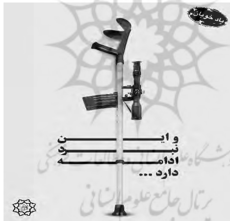
تصویر ۷. یاد خوبان

جهادی عینی تر سازد. به بیان دیگر، این نهاد هم بر «جهاد فرهنگی» و «جهاد اقتصادی» تأکید دارد و تلاش می‌کند مالکیت معنوی‌شان را به گفتمان خود مرتبط سازد و هم، با تأکید بر مشکلات اقتصادی و فرهنگی جامعه، به حاشیه‌راندن مؤلفه‌های گفتمان اصلاح‌طلبی را دنبال می‌کند همچنین با هم‌نشین کردن اقتصاد و فرهنگ، می‌خواهد اهمیت پیوند این دو دال شناور را افزایش دهد و توجه ملت به مطالبه‌های اقتصادی را در گستره عزم ملی قرار دهد و از این طریق، دال «عزم ملی» را منطبق بر گفتمان اصول‌گرایی، حول کانون مرکزی «ولایت‌مداری»، مفصل‌بندی کند و در معنای «امت» واحد تثبیت کند تا بتواند مطالباتشان را توسط عزم ملی و مدیریت جهادی هم‌ارز کند. در واقع، این نهاد درصدد است با آن دسته از کنشگران سیاسی و اقتصادی «ولایت‌مدار» و منتقد همیشگی سیاست‌های فرهنگی و اقتصادی اصلاح‌طلبان زنجیره هم‌ارزی تشکیل دهد و با ایجاد چالشی اقتصادی بر اساس منطق تفاوت، مفصل‌بندی گفتمان رقیب را به هم بریزد تا بتواند از طریق هم‌گرایی و جلب نظر و آرای این قبیل گروه‌های اجتماعی، شرایط دستیابی به قدرت سیاسی را فراهم کند.