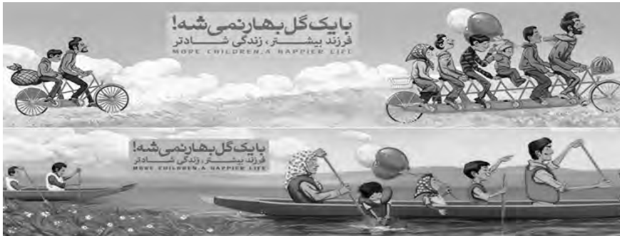
تصویر ۴. با یک گل بهار نمی‌شه

رقیب را به حاشیه براند و از طریق این غیریت‌سازی، علاوه بر برخورداری از تأیید و حمایت مراجع دینی، بر هویت و اعتبار گفتمان خودی بیفزاید و شرایط هژمونی فرهنگی و قدرت سیاسی برای گفتمان خودی فراهم شود.