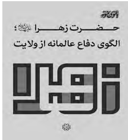
تصویر ۱. بانوی نمونه