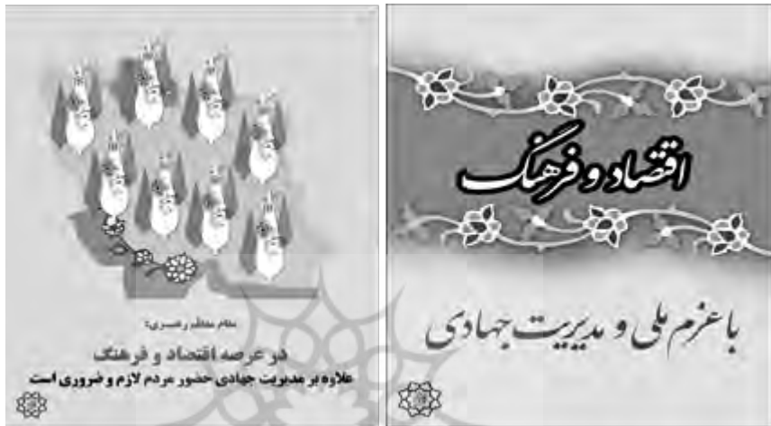
تصاویر ۵ و ۶. اقتصاد و فرهنگ

هر چیز، دال مرکزی «ولایت‌مداری» است که همچنان بر مفصل‌بندی این نهاد تأکید دارد. این نهاد درصدد برآمد تا با ترویج فرهنگ افزایش جمعیت و نشان‌دادن همسویی کامل با ولایت فقیه، وقته یا دال شناور «مدیریت جهادی» خود را حول کانون مرکزی «ولایت‌مداری» مفصل‌بندی کند.