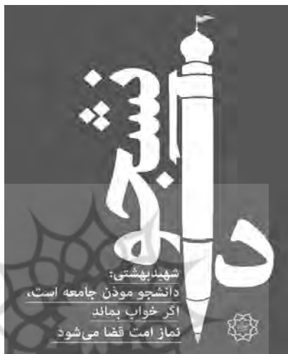
تصویر ۲. دانشجو

دولتی» گفتمان رقیب را به حاشیه براند و هم با برخی کنشگران سیاسی و اجتماعی (از قبیل: روحانیان، خانواده شهدا، رزمندگان و جانبازان، بسیجیان و...) که منتقد سیاست‌های فرهنگی دولت‌اند زنجیره هم‌ارزی تشکیل دهد. به بیان دیگر، سبک زندگی اسلامی را، که بر مبنای ساده‌زیستی و تقواست، به‌عنوان دال تهی، جایگزین مطالبه محرومیت‌زدایی و رفاه‌کند تا بتواند نظر و آرای آن‌ها را کسب کند.