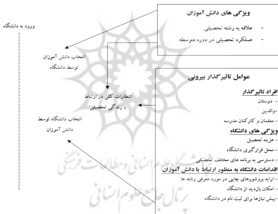
شکل (۱) الگوی انتخاب رشته و دانشگاه بر اساس دیدگاه بسویک

وزیان می‌دانند. در این الگوها دانش‌آموزان به‌عنوان مصرف‌کننده، فرایند انتخاب و تصمیم‌گیری را در چند گام طی می‌کنند. در الگوی چاپمن این گام‌ها شامل جستجوی اولیه (کسب اطلاعات درباره رشته‌ها و دانشگاه‌ها)، جستجو (فراهم کردن فهرستی از رشته‌ها و دانشگاه‌ها با توجه به مرحله قبل و مقایسه آنها با یکدیگر)، پذیرش (انتخاب رشته و پذیرش در دانشگاه) و در نهایت انتخاب و ثبت نام (تصمیم‌گیری در مورد نوع درس‌ها و برنامه ارائه شده) است. در الگوی کوتلر و کلر، انتخاب رشته و دانشگاه به‌عنوان یک فرایند حل مسئله مورد توجه قرار گرفته و دانش‌آموزان باید گام‌هایی را برای حل مسئله تا رسیدن به بهترین راه حل بردارند. الگوهای چاپمن و کوتلر و کلر در جدول (۱) خلاصه شده است.