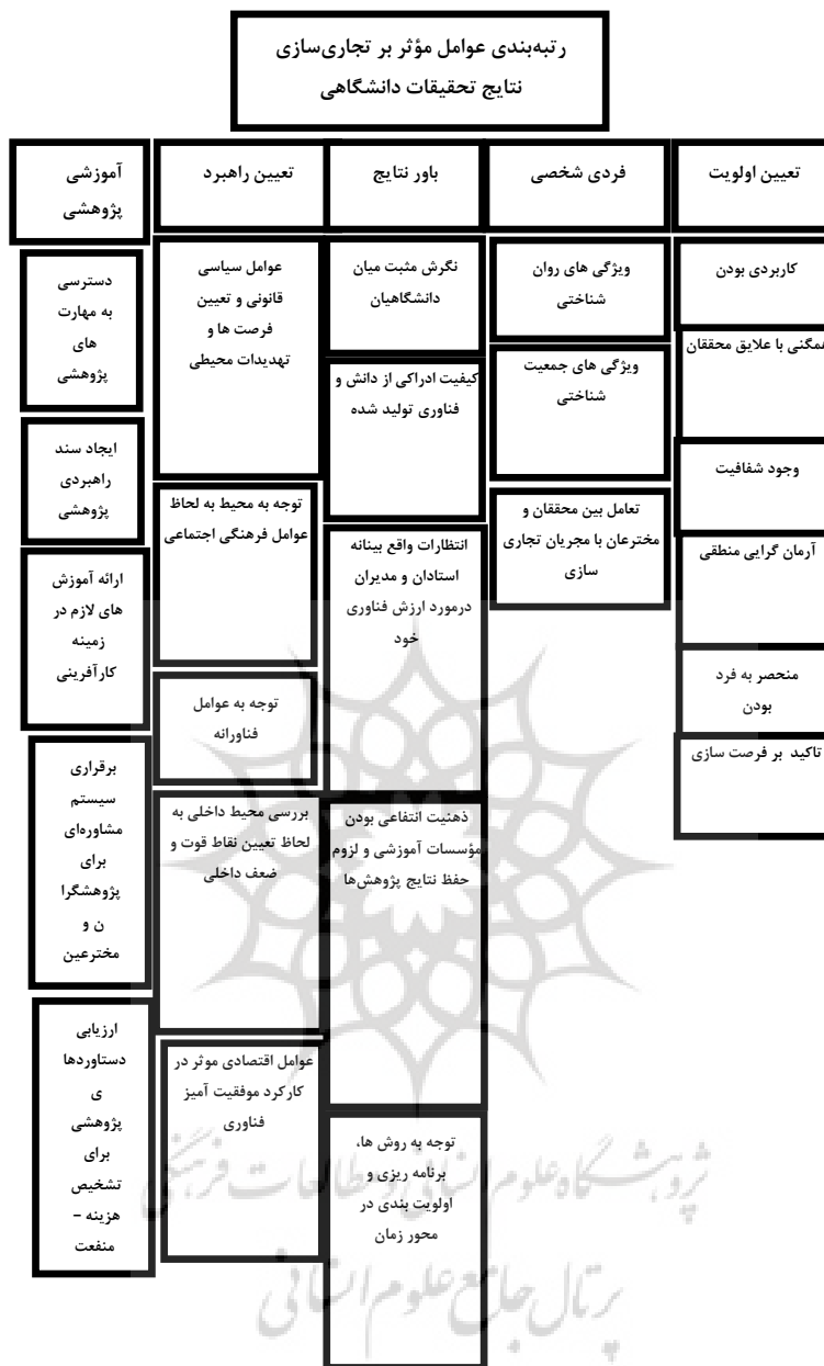
شکل (۲) ساختار سلسه‌مراتبی عوامل مؤثر بر تجاری‌سازی نتایج تحقیقات دانشگاهی