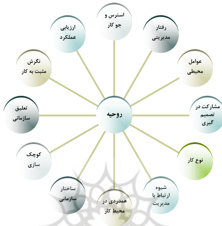
نمودار (۱) عوامل مؤثر بر روحیه

همانگونه که در نمودار (۱) پژوهش نشان می‌دهد، تاکنون از منظر عوامل مؤثر بر ارتقاء روحیه به روحیه نگاه نشده است، در این پژوهش درصدد است تا تأثیر عوامل مدیریتی، عوامل ساختاری، عوامل مالی، عوامل محیطی، عوامل تسهیلاتی و عوامل آموزشی / تحقیقاتی مؤثر بر روحیه اعضای هیئت علمی مورد بررسی قرار دهد.