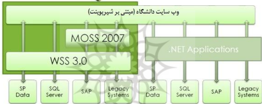
شکل (2) شمای کلی یک سیستم مبتنی بر شیرپوینت