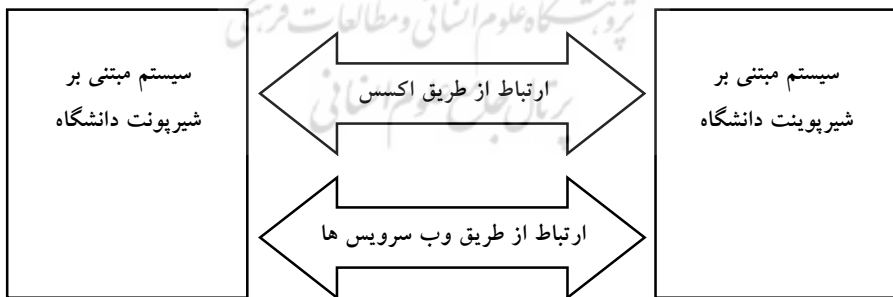
شکل (3) نحوه ارتباط دو سیستم مبتنی بر شیرپوینت دانشگاهی با یکدیگر