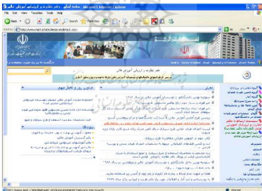
شکل (4) صفحه نخست وب سایت دفتر نظارت و ارزیابی آموزش عالی وزارت علوم،

این اقدامات همگی با استفاده از سرویس های شیرپوینت و برقراری ارتباط میان نرم افزارهای بسته آفیس و این سرویس ها و توسط کسانی به عمل آمده است که کاربران سطح پیشرفته مایکروسافت آفیس بوده اند و از هیچ ابزار برنامه نویسی استفاده نکرده اند و تنها در انجام گزارش گیری های پیچیده از اطلاعات پورتال نیاز به آشنایی با زبان پرس و جوی پایگاه داده SQL برای ساخت پرس و جوهای درون نرم افزار اکسس بوده است. بدیهی است که هیچ هزینه اضافی نیز در برای نگهداری و ساخت این سیستم ها وجود ندارد. شکل 4، صفحه نخست وب سایت دفتر نظارت و ارزیابی آموزش عالی وزارت علوم، تحقیقات و فناوری را به تصویر کشیده است.