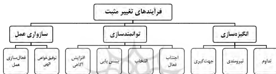
شکل ۱: فرآیندهای تغییر مثبت بر اساس شرایط دستیابی به سعادت در متون دینی

بر اساس ساختار مفهومی به دست آمده از مجموعه مشخصی از متون دینی، تحقق و کامل شدن سعادت از مسیر «رغبت/ میل»، «قدرت» و «توفیق/ اذن» به طور یکپارچه و متوالی، ممکن است. طبق تبیینی که گذشت این مفاهیم سه گانه، به سه فرآیند تغییر مثبت شامل انگیزه سازی، توانمندسازی و سازواری عمل اشاره دارند. شکل ۱ فرآیندها و عوامل مشخص آن‌ها را برای دستیابی به تغییر مثبت (سعادت) نشان می‌دهد.