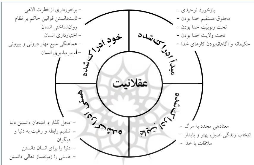
شکل ۲: هسته اصلی خود، حوزه‌های ادراکی و اصول آن

است. آنچه در این مراحل برای انسان مفید است اعمال او است و نسبت‌ها و جمع افراد و بستگان برای او کارآیی ندارد. دید یقینی او در اینجا این است که خداوند مالک اصلی همه چیز است (نور: ۲۴-۲۵). اگر ثمره مداخله ناشی از این اصل این باشد که انسان دید استقلالی خود را تضعیف کند بسیاری از زمینه‌های آسیب و بازگشت به اختلال از بین می‌رود.