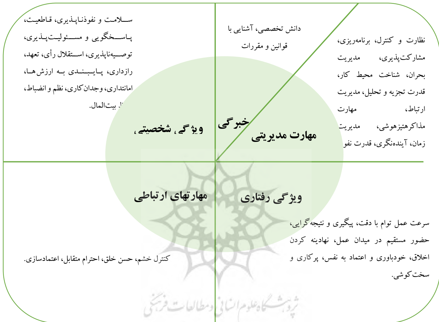
جدول ۳: الگوی پیشنهادی شایستگی مدیران قضایی

- براساس نتایج پژوهش، می‌توان شایستگی‌های زیر را به عنوان الگوی شایستگی مدیران قوه قضاییه پیشنهاد نمود.