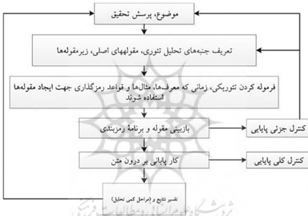
شکل شماره ۱: مدل مرحله کاربرد مقوله بندی قیاسی