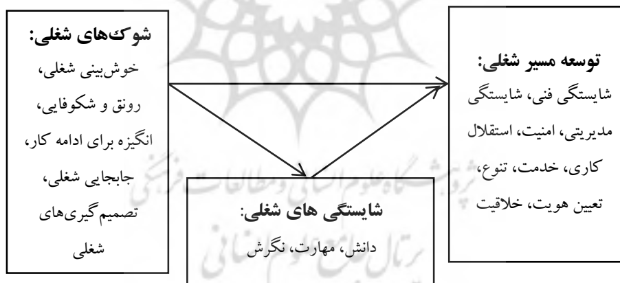
شکل ۱. مدل مفهومی پژوهش