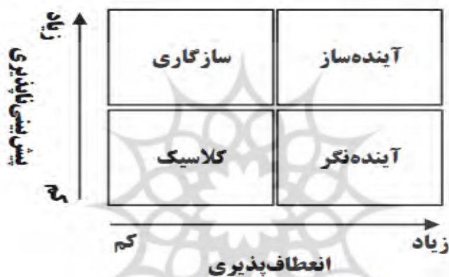
شکل ۱. رویکردهای مطرح در مدیریت راهبردی بنگاه (اکبری و همکاران، ۱۳۹۸: ۷۹)

گروه مشاوره بوستون به تازگی رویکردهای چهارگانه راهبرد در سازمان‌ها دوسوتوان را مطابق شکل ۱، مبتنی بر دو بعد پیش‌بینی‌پذیری و انعطاف‌پذیری مطرح کرد که چگونگی انتخاب مناسب‌ترین رویکردهای مدیریت راهبردی شرکت را تشریح می‌کند. هر یک از رویکردهای ذکر شده نه تنها شیوه‌های کاملاً متفاوت را در ایجاد راهبرد به همراه دارد، بلکه رویکرد متمایز در جاری‌سازی را نیز در پی دارد و نیازهایی متفاوت را ایجاد می‌کند (اکبری و همکاران، ۱۳۹۸).