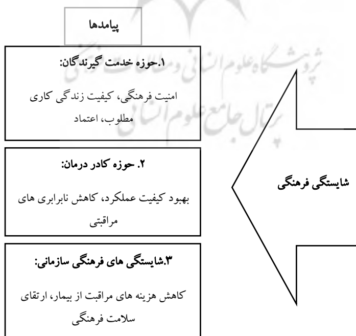
شکل ۳. مدل نهایی

کاربست دو روش تحقیق کیفی مرور سیستماتیک (فرا ترکیب) و دلفی می تواند به عنوان روشی ساختاریافته و منسجم، نتایج کاربردی، مفید و تخصصی را در شناسایی پیامدهای شایستگی فرهنگی حوزه بهداشت و درمان دولتی داشته باشد. نتایج نهایی حاصل از شناسایی پیامدهای شایستگی فرهنگی که در بخش بهداشت و درمان در این پژوهش ارائه گردیده است در شکل ۳ مشخص شده است.