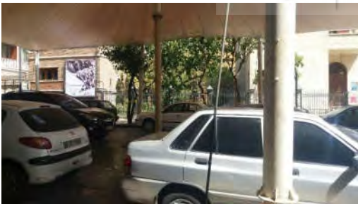
شکل ۳- سایه بان مدرن