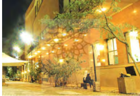
شکل ۴- مبلمان شهری (۳)