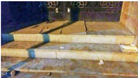
شکل ۱۶- مقابل پله‌های ساختمانی بلا تکلیف