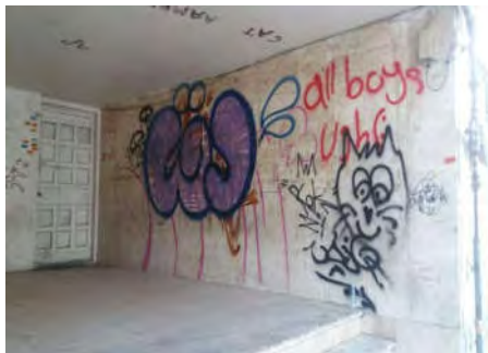
شکل ۱۱- ساختمان رهاشده