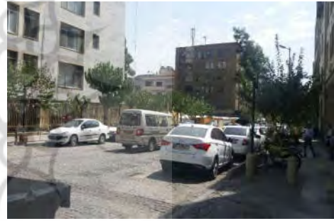
شکل ۶- پارک خودروها