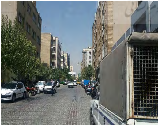
شکل ۹- پارک خودروها