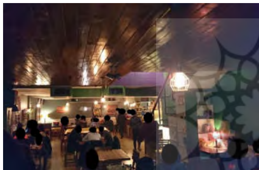
شکل ۱۳- نمای داخلی کافه ریچارد