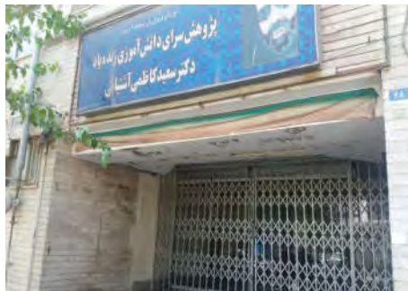
شکل ۱۰- ساختمان بلا تکلیف