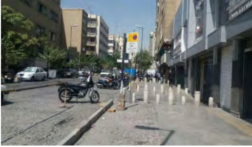
شکل ۵- تجهیز پیاده‌راه جانبی