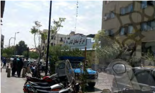
شکل ۷- پارک موتورسیکلت‌ها