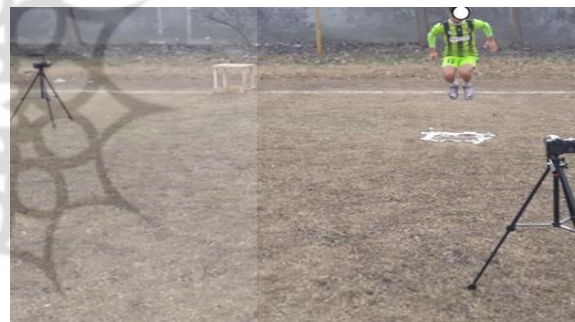
شکل ۲. روش ارزیابی پرش تاک جامپ

آزمون پرش تاک دارای روایی بالایی (اختصاصی بودن ۶۷ درصد و حساسیت ۸۴ درصد) است که به سهولت قابل اجرا است و محققان می توانند جهت شناسایی نقص های موجود در تکنیک و بیومکانیک فرود ورزشکاران از آن استفاده کنند [۱۷]. ابتدا، آزمودنی ها با استفاده از آزمون پرش تاک ارزیابی شدند و در نهایت، افراد مبتلا به نقص والگوس پویای زانو شناسایی شدند. برای اجرای پرش تاک، ورزشکار با پاهای باز به اندازه عرض شانه ایستاده و به صورت عمودی شروع به پرش کرده و زانوها را تا جایی که امکان دارد بالا می آورد. در بالاترین نقطه ی پرش، ران ها موازی با زمین قرار خواهند داشت. هنگام فرود، ورزشکار باید پرش تاک بعدی را شروع کند. این آزمون برای ۱۰ ثانیه اجرا شد (شکل ۲). فردی که قادر نباشد در محل شروع پرش، فرود بیاید یا در نقطه اوج پرش، ران هایش موازی زمین قرار نگیرد و پرش هایش در طول ۱۰ ثانیه با وقفه انجام شوند و در حرکت دچار والگوس زانو باشند، به عنوان فرد مبتلا به نقص والگوس پویای زانو در نظر گرفته می شود [۱۲].