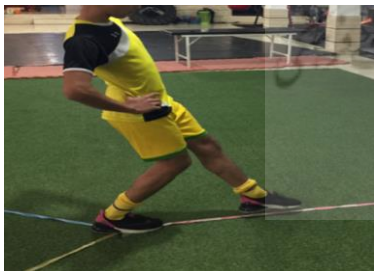
شکل ۳. روش ارزیابی تعادل پویا

از آزمون t دو گروه مستقل برای مقایسه خصوصیات دموگرافیک دو گروه استفاده شد. در رابطه با سایر متغیرهای وابسته، ابتدا نرمال بودن توزیع داده های مربوط به هر متغیر با استفاده از آزمون شاپیرو-ویلک بررسی شد. به دلیل نرمال بودن توزیع داده ها از آزمون تحلیل کواریانس استفاده شد. سطح معناداری در سطح اطمینان ۹۵ درصد پذیرفته و داده ها با استفاده از نرم افزار spss نسخه ۲۶ تجزیه و تحلیل شد.