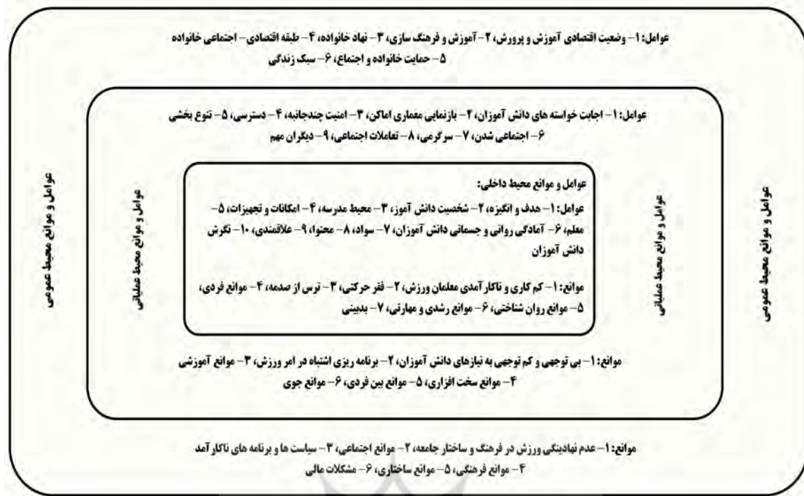
شکل ۴- مضامین تحلیلی مرتبط با عوامل و موانع مؤثر بر مشارکت دانش آموزان در ورزش

فعالیت های ورزشی مدارس معرفی کرده بودند، دهقان پور و همکاران (۱۴۰۲)، صفری و همکاران (۱۴۰۲) که نشان دادند حمایت اجتماعی یک تعیین کننده مهم برای مشارکت در ورزش دانش آموزان است، عبدی و همکاران (۱۴۰۱) که عوامل فرهنگی و محیطی را مؤثر بر رفتارهای پایدار در خصوص مشارکت ورزشی معرفی کرده اند و شهبولی کوه شوری و همکاران (۱۴۰۱) که گزارش کردند که پیشران های مؤثر بر آینده ورزش تربیتی تابع دسته های اجتماعی، اقتصادی و سیاسی است، آلمیدا و همکاران (۲۰۲۳) که به عوامل زمینه ای اشاره داشتند، هانسن و همکاران (۲۰۲۳) مبنی بر اینکه حمایت و خانواده را مؤثر بر مشارکت در ورزش می دانستند، کاین و همکاران (۲۰۲۳) که به این نتیجه رسیدند موانع فعالیت بدنی دانش آموزان اجتماعی و محیطی است، چن و همکاران (۲۰۲۳) به جهت اینکه گزارش کردند عوامل محیطی بیشترین نقش را در محدودیت فعالیت بدنی کودکان و نوجوانان دارد، می باشد.