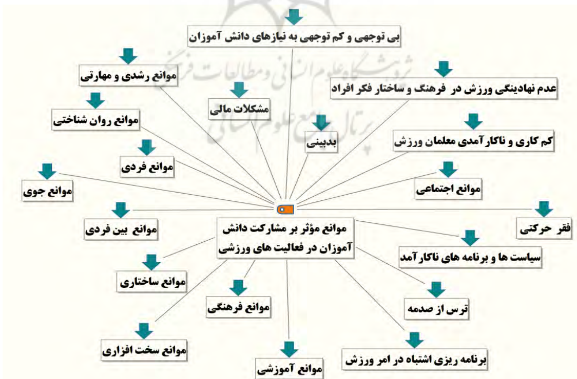
شکل ۳- مضامین توصیفی مرتبط با موانع مؤثر بر مشارکت دانش آموزان در فعالیت های ورزشی