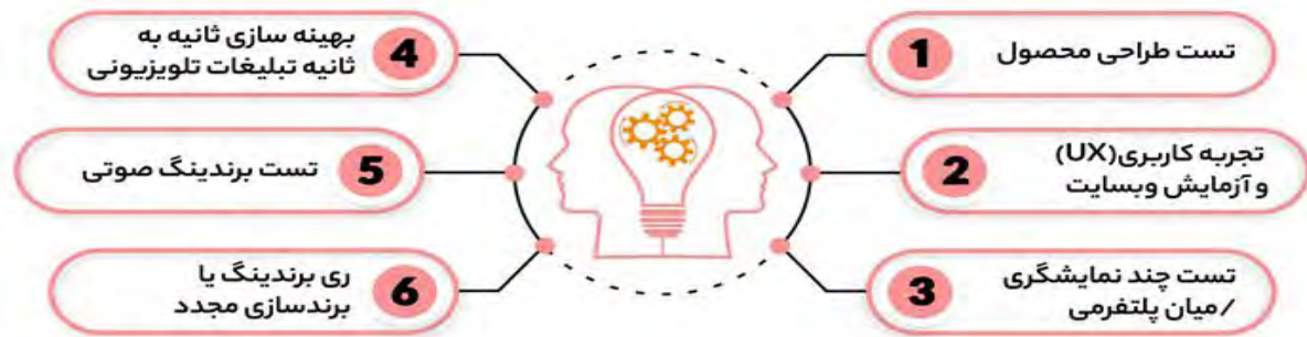
شکل ۲. کاربردهای بازاریابی عصبی

فعال می‌شود. این نتایج با استفاده از دستگاه ام آر آی تصاویری روشن‌تر از نواحی غیرفعال مغز را نشان می‌دهد و نشان می‌دهد که تبلیغات و وفاداری به برند، انگیزه‌های