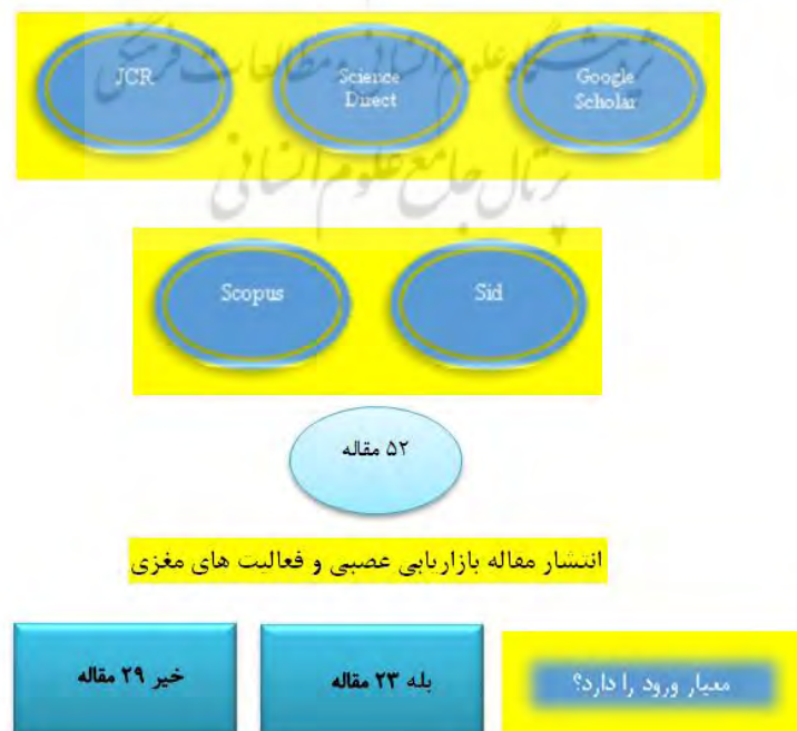
شکل ۳ روند جستجو، بررسی و انتخاب مقالات

مطالعه حاضر از نوع مروری بود و هدف از مطالعه حاضر تحلیل بازاریابی عصبی و تاثیر آن بر فعالیت‌های مغزی