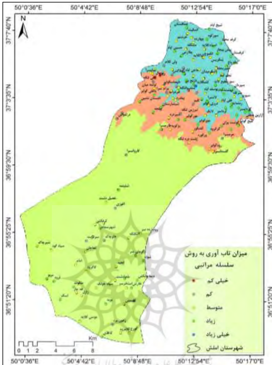
شکل ۳. مدل نهایی میزان تاب‌آوری روستاهای شهرستان املش نسبت به پدیده زمین‌لغزش با استفاده از روش تحلیل سلسله مراتبی

میزان تاب‌آوری روستاها با روش تحلیل سلسله مراتبی در ۵ طبقه خیلی کم (ارزش ۳)، کم (ارزش ۴)، متوسط (ارزش ۵)، زیاد (ارزش ۶) و خیلی زیاد (ارزش ۷) خلاصه شده است. با توجه به جدول (۶)، درصد روستاهای با تاب‌آوری خیلی کم، کم، متوسط، زیاد و خیلی زیاد به ترتیب برابر با ۱/۳۹، ۱۵/۹۶، ۴۵/۸۳، ۳۶/۱۳ و ۰/۶۹ محاسبه شد. بعبارت دیگر ۶۳/۱۸ درصد روستاهای این ناحیه دارای تاب‌آوری متوسط به پایین و ۳۶/۸۲ درصد آنها دارای تاب‌آوری زیاد و خیلی زیاد هستند. همچنین توزیع درصد فراوانی تاب‌آوری روستاها براساس قرارگیری آنها در ناحیه جلگه‌ای، کوهپایه‌ای و کوهستانی نتایج دقیق‌تری را بدست می‌دهد، بطوریکه درصد روستاهای با تاب‌آوری خیلی کم، کم، متوسط، زیاد و خیلی زیاد در ناحیه جلگه‌ای برابر با صفر، ۴/۱۶، ۲۲/۹۲، ۲۰/۱۴ و ۰/۶۹ درصد، در ناحیه کوهپایه‌ای برابر با ۱/۳۹، ۶/۹۴، ۸/۳۳، ۶/۹۴ و صفر درصد و در ناحیه کوهستانی برابر با صفر، ۴/۸۶، ۱۴/۵۸، ۹/۰۵ و صفر درصد از درصد کل، روستاهای شهرستان املش را در بر می‌گیرند. در نتیجه روستاهای با تاب‌آوری متوسط به پایین در ناحیه جلگه‌ای (۲۷/۰۸ درصد) بیشتر از دو ناحیه دیگر (۱۶/۶۶ و ۱۹/۴۴ درصد) بوده و این مهم در مورد روستاهای با تاب‌آوری زیاد و خیلی زیاد هم صدق می‌کند. با توجه به سهم روستاهای واقع در هر سه ناحیه یعنی ۴۶/۹۱، ۲۳/۶ و ۲۸/۴۴ درصد، نتیجه‌گیری فوق‌تر از انتظار نخواهد بود.