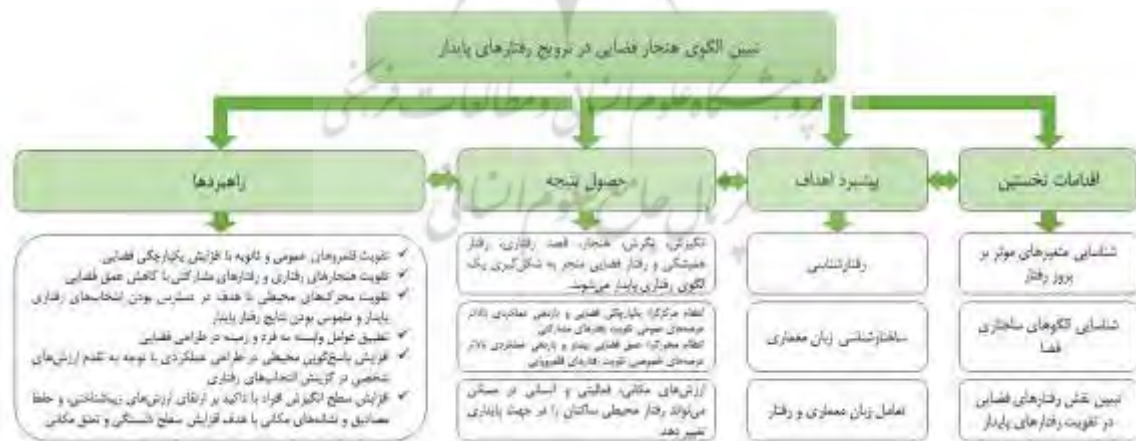
شکل ۴. الگوی پیشبرد اهداف تحقیق