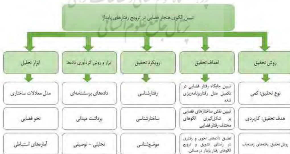
شکل ۱. ساختار و فرآیند تحقیق