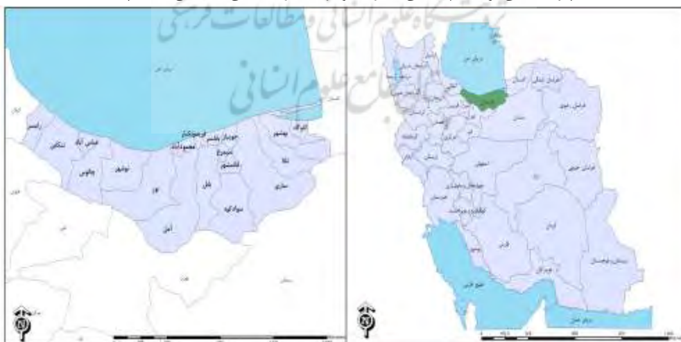
شکل ۱. موقعیت جغرافیایی محدوده مورد مطالعه

استان مازندران با وسعت ۲۳۷۵۶/۴ کیلومتر مربع، در نیمه‌ی شمالی کشور، بین ۳۵ درجه و ۴۶ دقیقه تا ۳۶ درجه و ۵۸ دقیقه عرض شمالی، از خط استوا و ۵۰ درجه و ۲۰ دقیقه تا ۵۴ درجه و ۱۰ دقیقه طول شرقی، از نصف النهار گرینویچ قرار دارد. حد شمالی آن، دریای خزر، حد جنوبی، استان‌های تهران و سمنان، حد غربی، گیلان و حد شرقی، استان گلستان می‌باشد. در سال ۱۳۹۸، مازندران دارای ۲۲ شهرستان و ۶۱ شهر بوده است. بر اساس سرشماری ۱۳۹۵، جمعیت استان ۳۲۸۳۵۸۲ نفر بوده که از این تعداد ۵۷/۶ درصد در شهرها ساکن بوده‌اند (سازمان مدیریت و برنامه‌ریزی استان مازندران، ۱۳۹۶).