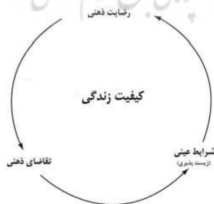
شکل ۱. مدل ارتباط زیست پذیری و کیفیت زندگی

همان طوریکه در ادبیات علمی نیز تأکید شده است، کیفیت زندگی، مفهومی پیچیده و چند بعدی است که تحت تأثیر مؤلفه‌هایی چون زمان و مکان، ارزش‌های فردی و اجتماعی قرار دارد و ازاین‌رو معانی گوناگونی برای افراد و گروه‌های مختلف بر آن مترتب است. برخی آن را به‌عنوان قابلیت زیست پذیری یک ناحیه، برخی دیگر به‌عنوان اندازه‌ای برای میزان جذابیت و برخی به‌عنوان رفاه عمومی، بهزیستی اجتماعی، شادکامی، رضایتمندی و مواردی ازاین‌دست تعبیر کرده‌اند (رضوانی، منصوریان، ۱۳۸۷). کیفیت زندگی یک مفهوم عینی و ذهنی است که مسائل مختلفی را درباره مردم مختلف ارائه می‌دهد (Kalfoss & Halvorsrud, 2009: 45). کیفیت زندگی همانند زیست پذیری مفهومی پیچیده و چندبعدی است که از مؤلفه‌هایی نظیر مکان و زمان و نیز ارزش‌های فردی و اجتماعی تأثیر می‌پذیرد و ازاین‌رو از دیدگاه‌های افراد و گروه‌های مختلف، با معانی گوناگونی همراه است. برخی آن را مترادف با زیست پذیری یک ناحیه، برخی دیگر اندازه‌گیری برای میزان جذابیت و برخی نیز رفاه عمومی، بهزیستی اجتماعی، شادکامی، رضایتمندی و مواردی ازاین‌دست تعبیر کرده‌اند (شکل ۱) (پورطاهری و همکاران، ۱۳۹۰).