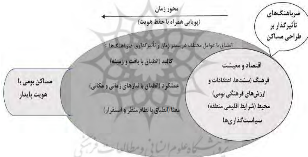
شکل ۱. پایداری مسکن بومی در بستر زمان و شرایط زمینه‌ای همزمان با تأثیرگذاری ضرباهنگ‌ها

با توجه به مبانی نظری و اهداف تحقیق می‌توان مدل مفهومی تحقیق را با توجه به عناصر هویت‌ساز پایدار مسکن بومی در بستر زمان و تأثیرگذاری ضرباهنگ‌های مختلف به شرح شکل (۱) ترسیم نمود.