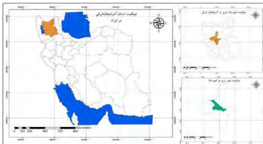
شکل ۱. موقعیت جغرافیایی کلان‌شهر تبریز