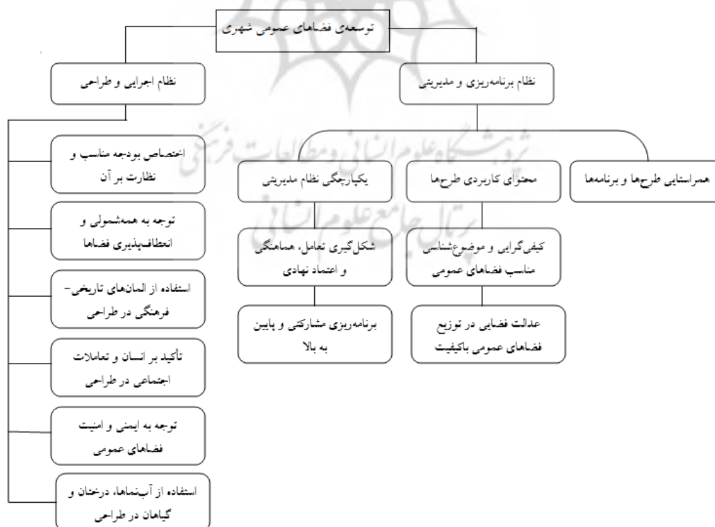
شکل ۳. چارچوب تبیینی از معیارهای تأثیرگذار برنامه‌ریزی و طراحی بر توسعه فضاهای عمومی شهر تبریز

با توجه به نتایج حاصل از بررسی و شناسایی معیارهای تأثیرگذار بر توسعه فضاهای عمومی شهر تبریز، می‌توان چارچوب تبیینی مورد نظر در راستای توسعه این فضاها در شهر تبریز را به شرح شکل (۳) ترسیم نمود.