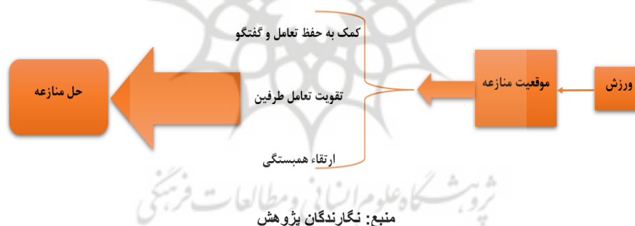
شکل (۲) ورزش و حل منازعه (SCR)