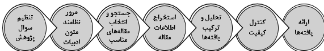
شکل ۱. مراحل پژوهش براساس روش هفت مرحله‌ای ساندلوسکی و باروسو (۲۰۰۷)

در پژوهش حاضر برای انجام مراحل فراترکیب، مطابق شکل شماره ۱ از روش هفت مرحله‌ای ساندلوسکی و باروسو ۱ (۲۰۰۷) بهره برده شده است. متن‌های استخراج شده از تحقیقات با استفاده از استراتژی تحلیل محتوای پنهان مورد تجزیه و تحلیل قرار گرفته‌اند. کدگذاری و خلاصه‌سازی داده‌ها در پژوهش حاضر، با استفاده از نرم‌افزار MAXQDA نسخه ۲۰۲۰ انجام شده است. بعد از بدست آوردن کدهای پژوهش، از ضریب توافق یا کاپا به‌منظور تعیین صحت و تأیید پایایی کدها استفاده شده است.