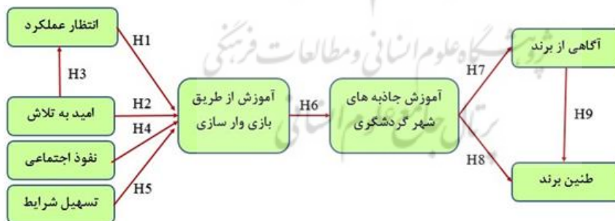
شکل ۱- مدل تحقیق

پژوهش حاضر بررسی تاثیر یادگیری جاذبه‌های گردشگری از طریق بازی‌وار سازی در بین کودکان دبستانی شهر تبریز را بررسی می‌کند. جامعه آماری این پژوهش از میان ۳۸۴ نفر از معلمان، مربیان، خبرگان و پژوهشگران نظام‌های آموزشی شهر تبریز که بطور مستقیم با این مبحث آشنایی و با کودکان تعامل داشتند انتخاب گردید. این پژوهش از لحاظ هدف کاربردی، از نظر زمان اجرای پژوهش، مقطعی؛ از نظر نوع داده، کمی و روش گردآوری داده‌ها و یا ماهیت و روش پژوهش، توصیفی-همبستگی بود. ابزار بکار گرفته شده برای گردآوری اطلاعات نیز بر اساس پرسشنامه، آزمون و مصاحبه در نظر گرفته شد و برای تعیین اعتبار محتوایی و روایی پرسشنامه و نتایج مصاحبه‌ها، از خود مربیان مدارس در تفهیم و ثبت پاسخ مخاطبان استفاده گردید. انتخاب روش نمونه‌گیری در این پژوهش بر مبنای تصادفی و از نوع، تصادفی طبقه‌ای تعیین گردید. محاسبات آماری آن نیز با ثبت اطلاعات و داده‌های جمع‌آوری شده، پیش‌پردازش و غربالگری داده‌ها (حذف داده‌هایی که مشکلاتی چون مقادیر گمشده، کیس‌های تکراری، داده‌های پرت و ... می‌باشند) توسط نرم افزار SPSS 26 و AMOS و در قالب عملیات آمار توصیفی و آمار استنباطی با تجزیه و تحلیل داده‌ها و آزمون فرضیات به‌عمل آمد. در تعیین اعتبار محتوایی و روایی پرسشنامه با توجه به ارتباط منطقی پرسش‌ها یا گویه‌ها با سازه مورد نظر و اعتبار توانایی ارزیابی موارد مورد سنجش تأیید و با استفاده از نظر خبرگان مشخص شد که پرسش‌های آزمون به طور دقیق آن چه را که مورد نظر است را به وسیله نرم افزارهای انتخابی می‌سنجند.