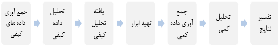
شکل (۲) - فرآیند تحقیق ترکیبی اکتشافی متوالی (کرسول و پلانوکلاک، ۲۰۱۱)