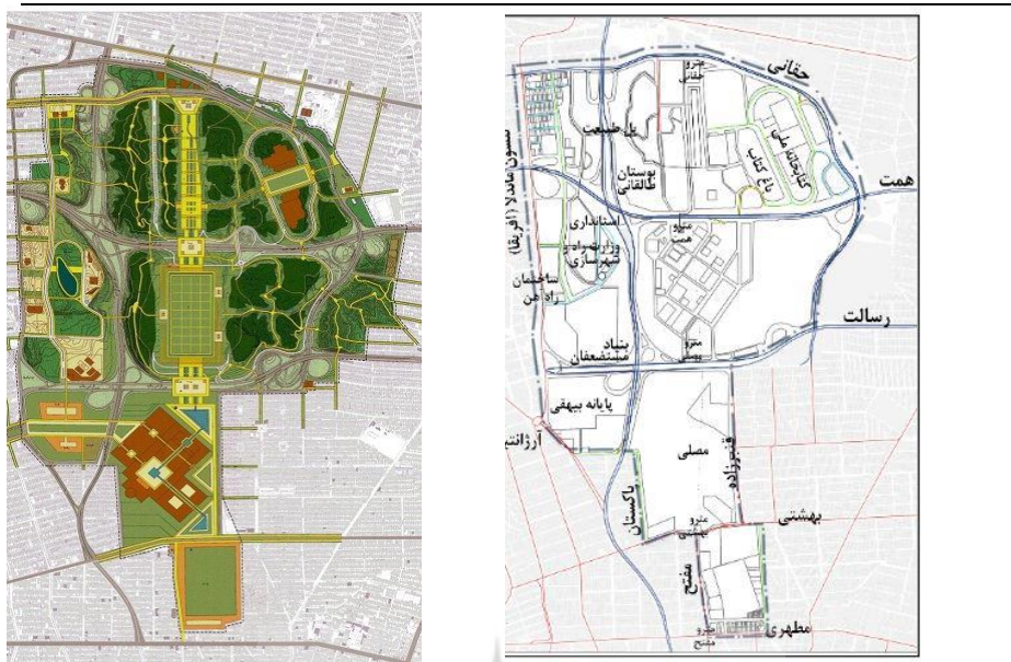
شکل ۲- موقعیت استقرار اراضی عباس آباد