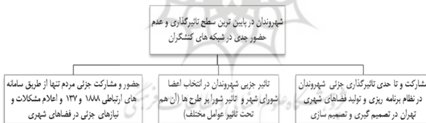
شکل ۶: فقدان حضور مؤثر شهروندان در شبکه کنشگران تولید فضای شهری اراضی عباس آباد

عدم نقش و تأثیرگذاری شهروندان در مراحل تهیه و تصویب و اجرای طرح، فقدان جایگاه قانونی برای شهروندان بین کنشگران از لحاظ تأثیرگذاری و قدرت، باعث قرار گرفتن شهروندان در پایین ترین سطح تأثیرگذاری و فقدان حضور جدی در شبکه کنشگران اصلی تولید فضا شده است (شکل ۶).