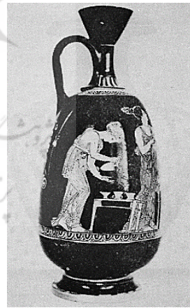
تصویر شماره ۱: صحنه آب دادن باغ‌های آدونیس، قرن ۵ پ.م، محل نگهداری: موزه آکروپولیس (کیم ۱۹۷۹: ۱۳)