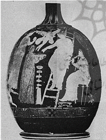
تصویر شماره ۲: صحنه‌ای از جشنواره آدونیس، حدود قرن ۴ پ.م، محل نگهداری: موزه بریتانیا (همان: ۱۴)

اطعام جمعی نیز بخشی از این مراسم آیینی بود. تندیس‌های مومی و گلی آدونیس را بر دروازه‌ها یا ایوان خانه‌ها قرار می‌دادند، قربانی و اطعام جمع می‌کردند و زنان سوگوار، گریان و سینه‌زنان دور این مجسمه‌ها جمع شده یا در حالی که آیین‌وار می‌رقصیدند آن‌ها را در شهر می‌گرداندند و با نوای آرام فلوت، نوحه‌سرایی می‌کردند. نوحه‌هایی که گیگورو (۷) یا گیگورا نامیده می‌شد. (ژیوان و همکاران ۱۳۷۵: ۱۷۲ - ۱۷۱) بخشی از این مراسم آیینی به این صورت بود که هر ساله بذرهایی از گندم سفید، کاهو، رازیانه و انواع گل‌ها را در ظروف مختلف می‌کاشتند و با آب گرم آبیاری می‌کردند تا زودتر جوانه زده و رشد کنند. (تصویر شماره ۳) سبدها یا سینی‌های سبزه را «باغ‌های آدونیس» می‌نامیدند. گیاهانی که به این شیوه رویانده می‌شد خیلی زود از بین می‌رفت که یادآور هستی زودگذر آدونیس بود و زنان برگزارکننده این مراسم بر سرگذشت تلخ او، همانند آفرودیت می‌گریستند و به شیون و زاری می‌پرداختند. (گریمال ۱۳۹۱: ۲۴)