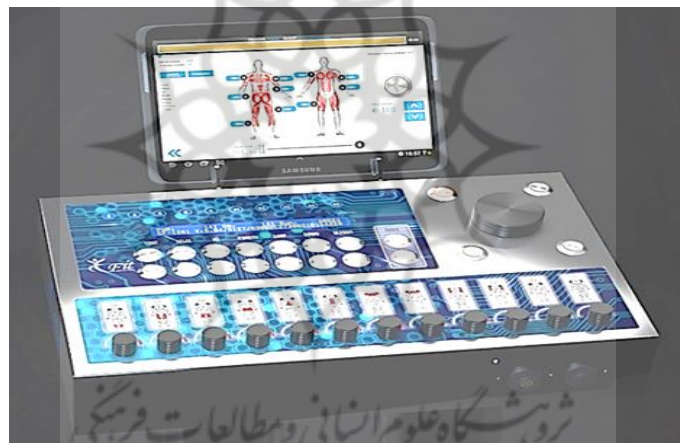
شکل (۲)، دستگاه الکترومايواستموليشن کل بدن E-Fit