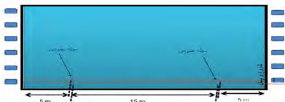
شکل ۱- نحوه نصب میله های عمودی برای ارزیابی تواتر و طول ضربه در کنار استخر

روبه روی خط فرضی در امتداد دو میله می گذشت در آن جا ساکن بود (فیلم بردار در ۱۵ متری وسط طول استخر حرکت می کرد) و به همین صورت از کل اجرای ۱۰۰ متر کراال سینه فیلم برداری به عمل آمد (۱۶). فیلم برای اندازه گیری زمان های به دست آمده و همچنین شمارش ضربه های دست شناگر در فواصل یاد شده به رایانه منتقل شد و تعداد ضربات دست و زمان های صرف شده در این فواصل استخراج شد و با استفاده از فرمول زیر تواتر ضربه در این فواصل به دست آمد (۲۰، ۱۹). 60 \times [ \text{زمان صرف شده برای فاصله معین به ثانیه} ] / \text{تعداد ضربه دست در فاصله معین} = \text{تعداد ضربه دست در دقیقه}