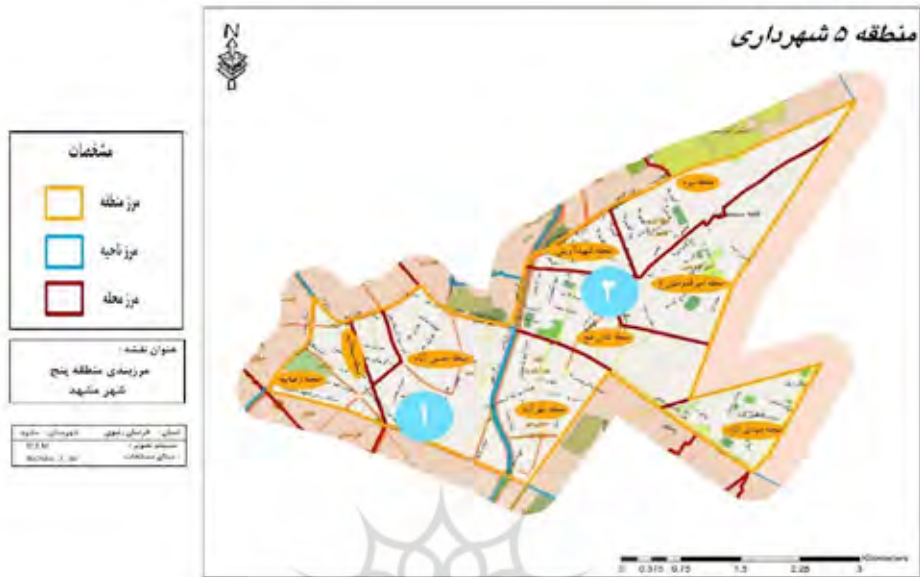
شکل ۴) نقشه مرزبندی محله‌ها و نواحی منطقه ۵ شهر مشهد