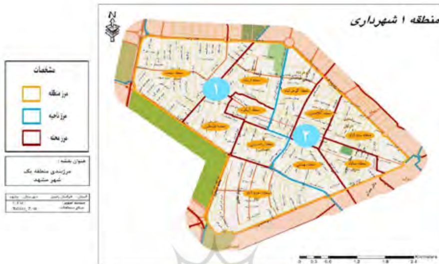
شکل ۳) نقشه مرزبندی محله‌ها و نواحی منطقه ۱ شهر مشهد