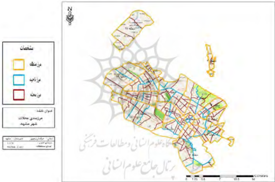
شکل ۲) نقشه مرزبندی مناطق، نواحی و محله‌های مناطق ۱۳ گانه شهر مشهد

نفر تعیین گردید. روش نمونه‌گیری در این پژوهش، خوشه‌ای چند مرحله‌ای، شامل (منطقه، ناحیه شهری، محله، بلوک و خانوار) است که در وهله اول از سیزده منطقه شهر مشهد با توجه به سطح توسعه یافتگی و برخورداری از شاخص‌های خدمات شهری مناطق با استفاده از نمونه‌گیری تصادفی ساده دو منطقه شهر که از منطقه میان توسعه یافته، منطقه ۱ و از منطقه محروم، منطقه ۵ انتخاب شدند و سپس در هر منطقه سه محله و از هر محله پنج بلوک و از میان بلوک‌ها، خانوارها به روش تصادفی سیستماتیک انتخاب شدند.