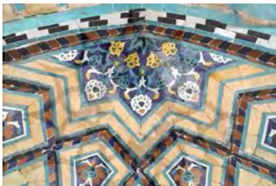
تصویر ۳) گنبدسبز - طاق‌نماهای شمال غربی، نیم‌شمسه (نگارندگان)

کاشی کاری با اشکال هندسی از نوع شطرنجی و چلیپائی ۱ است با سنگ مرمر سفیدرنگ مزین گردیده است. بخش دوم که نمای زیر سقف طاق نماها را شامل می‌شود، با تقسیم سطوح به وسیله باریکه کاشی‌های برجسته سفید و لاجوردی‌رنگ، قابچه‌ها، تزئینات رسمی و نیم‌شمسه‌هایی به وجود آمده‌اند (تصویر ۳). سطوح داخلی هر کدام از این اشکال تزئینی مذکور را با کاشی‌های معرق الوان با نقوش گیاهی اسلیمی و ختایی مجدداً تزئین شده است. کاشی‌های معرق منقوش در طاق‌نمای تحتانی بر روی یک زمینه آجری به کار رفته‌اند.