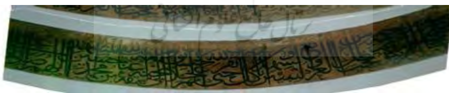
تصویر ۹) گنبدسبز - نمای داخلی، کتیبه منطقه انتقالی، هنرمند خوشنویس و ماده تاریخی ۱۰۵۸ ق.