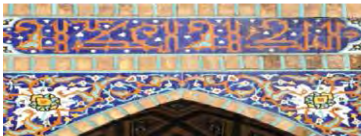
تصویر (۴) گنبدسبز - کتیبه فوقانی طاق نمای شمال غربی (نگارندگان)

در نمای فوقانی طبقه اول و نزدیک به رخیام بنا، نغول مستطیل شکل مزین به کاشی‌های معرق الوان با نقوش گیاهی اسلیمی و گل‌های شاه‌عباسی به همراه نقوش ترنج بر زمینه‌ای لاجوردی به کار رفته است.