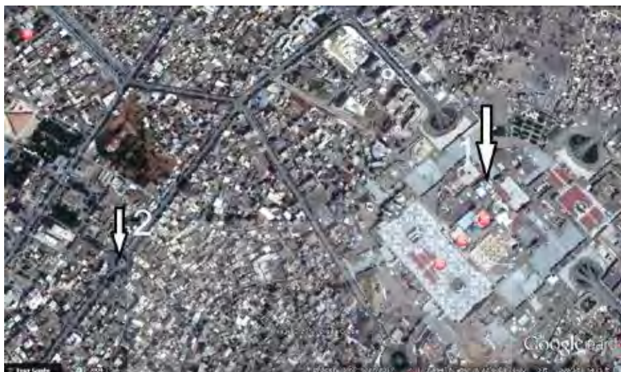
تصویر (۱) مشهد ۱- حرم امام رضا (ع) ۲- گنبد سبز

۳/۱۳۷۰ در فهرست آثار ملی به ثبت رسیده است.