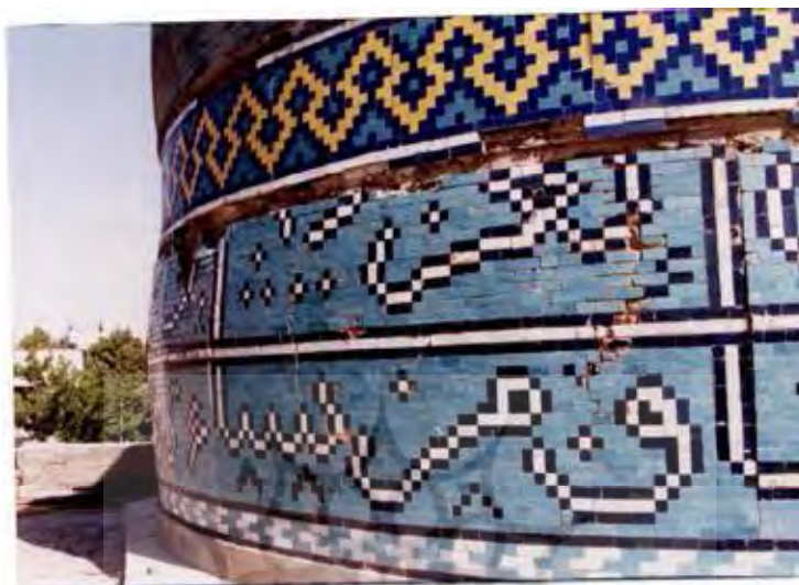
تصویر ۸) گنبد سبز - ساقه (گریو) و تزئینات کاشی‌کاری

در متن کاشی فیروزه‌های جلب توجه می‌کند (تصویر ۸).