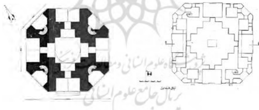
طرح ۵) مشهد - آرامگاه خواجه ربیع، قرن ۱۱ ق. طرح ۶) نیشابور - قدمگاه، قرن ۱۱ ق. (اداره کل میراث .... ۱۳۷۶) (مولوی، ۱۳۵۴: ۳۴۲)