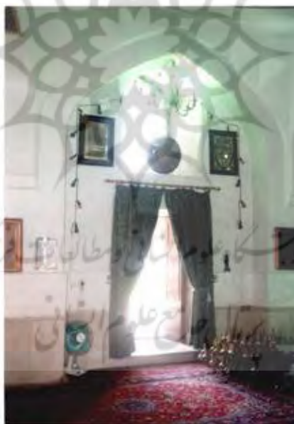
تصویر ۶) گنبدسبز - نمای داخلی، جبهه جنوبی (نگارندگان)

در هر کدام از اضلاع چهارگانه، ورودی‌های بنا تعبیه شده که در قسمت فوقانی آنها پنجره مشبک چوبی با قوس جناغی واقع گردیده است. ورودی‌ها و پنجره‌های فوقانی هر کدام با یک طاق‌نما احاطه گردیده است (تصویر ۶). این ورودی‌ها هر کدام از دو لنگه در چوبی با تزئینات هندسی گره تشکیل می‌گردند. طاق پنجره‌ها بر خلاف سردرها که مسطح می‌باشد، از نوع جناغی است (تصویر ۷).