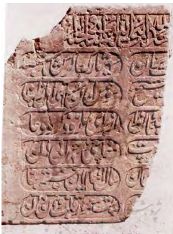
تصویر ۱۰) گنبدسبز - لوحه سنگی (اداره کل میراث ... ۱۳۷۶)

با توجه به ماده تاریخی که در مصرع آخر - بیت معمور قلب مؤمن دان - آمده، مشخص می‌گردد که ساخت بنای گنبدسبز در سال ۱۰۳۶ ق. به اتمام رسیده است (تصویر ۱۰).