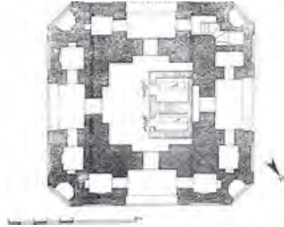
طرح ۱) گنبدسبز - پلان (اداره کل میراث ...، ۱۳۷۶)