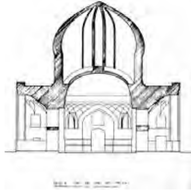
طرح ۲) گنبدسبز - نما و مقطع (اداره کل میراث ...، ۱۳۷۶)