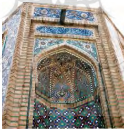
تصویر (۵) گنبدسبز - طاق‌نما و تزئینات جنوب شرقی (نگارندگان)

سایر طاق‌نماهای جنوب شرقی، شمال شرقی و جنوب غربی نیز از نظر شکل ساختمانی، نقوش و تزئینات به کار رفته کاملاً قرینه و شبیه طاق‌نماهای شمال غربی است، با این تفاوت که زمینه نقوش زیر سقف طاق‌نمای طبقه همکف زردرنگ و از جنس کاشی است (تصویر ۵).