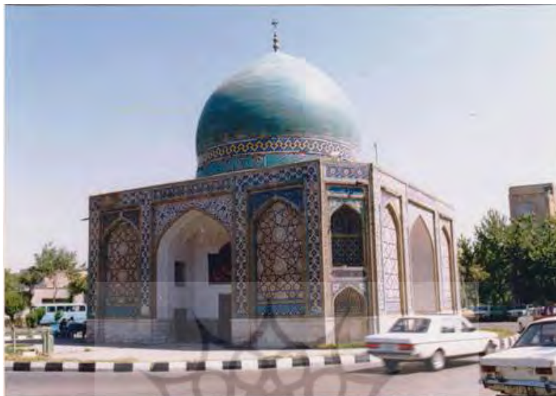
تصویر ۲) گنبدسبز، نمای بیرونی (نگارندگان)