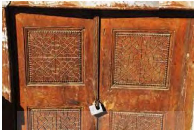
تصویر ۷) گنبدسبز - درهای چوبی با تزئینات هندسی

کف سنگ‌فرش بنا که در گذشته با آجرهای شش‌گوشه مفروش گردیده بود، نسبت به مدخل‌های چهارگانه از یک اختلاف سطحی برخوردار بوده و پایین‌تر قرار گرفته است. ازاره‌ای از سنگ مرمر شیری‌رنگ به ارتفاع ۷۶ سانتی‌متر دور تا دور نمای داخلی را دربر گرفته است.