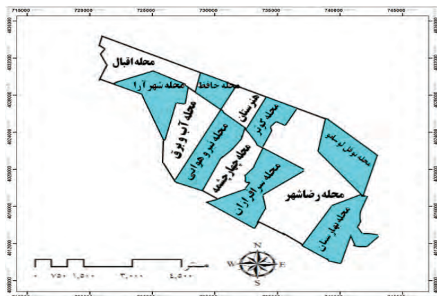
شکل ۲) محلات منطقه ۹ مشهد (سایت شهرداری مشهد، ترسیم: نگارندگان)