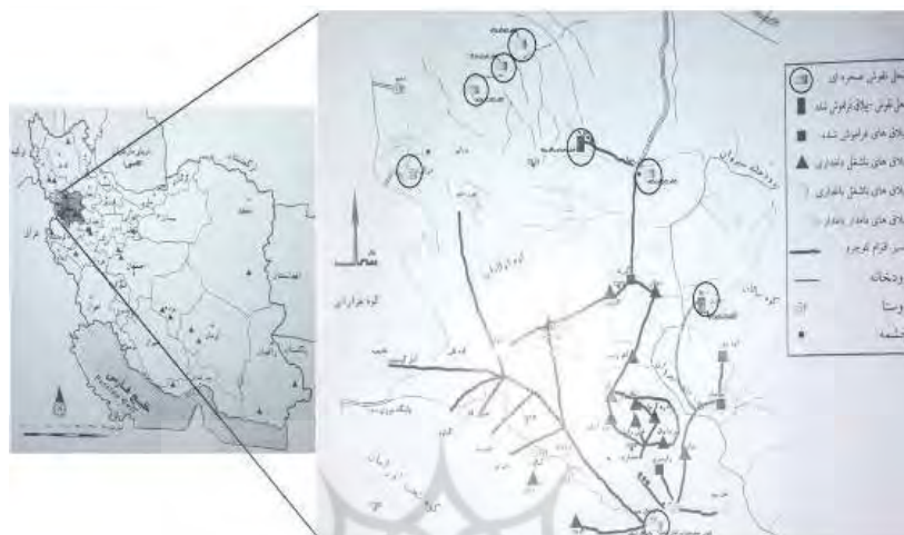
نقشه ۲) پراکنش نقوش صخره ای در اورامان (قسیمی، ۱۳۸۶: ۷۳-۷۴)