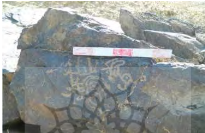
تصویر (۱۱) نقش بزکوهی همراه با نقوش نمادین در شکارگاه در سنگ نگاره رامنگان ۲ (قربانی، ۱۳۹۲: ۱۳۰)

از پرتوهای خورشید و گردش آن حاکی از مسیر خورشید در عرض آسمان بوده است» (هال، ۱۳۹۰: ۱۳۳). به این ترتیب، ارائه این دو نقش به تنهایی و یا به صورت ترکیبی از هردو، از ریشه های فرهنگی کهن و سابقه ای دیرینه برخوردار است (جدول ۴).