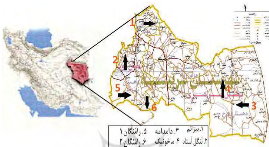
نقشه ۱) پراکنش نقوش صخره ای در سربیشه (قربانی، ۱۳۹۲: ۲۶۱)