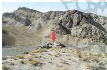
تصویر ۶) نمایی از صخره محوطه رامنگان ۲