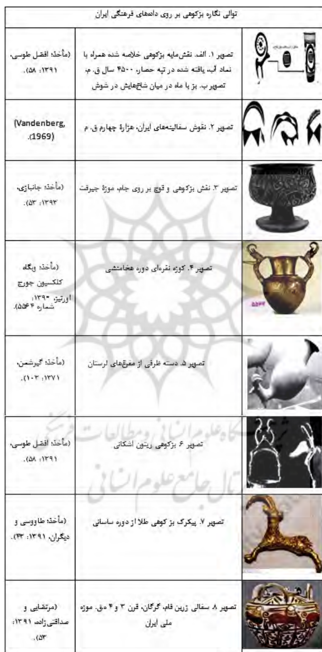
جدول ۶) نقش بزکوهی بر روی داده های فرهنگی ایران باستان (نگارندگان، ۱۳۹۴)