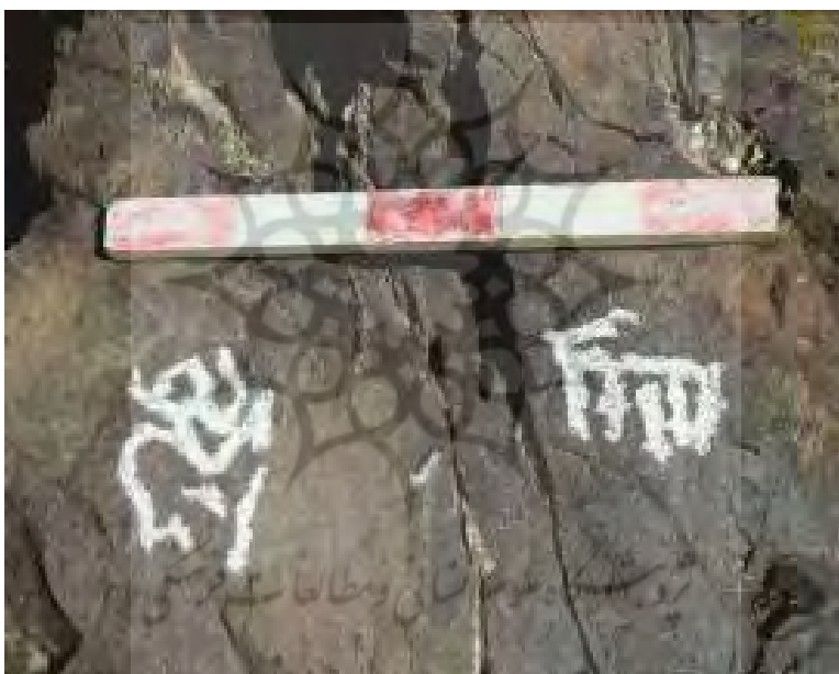
تصویر ۱۰) نقش بزکوهی همراه با نقوش انسانی در شکارگاه در سنگ نگاره رامنگان ۱

دشمن تیراندازی می کردند. با آن که این رسم قیقاج زدن، از قدیم میان سکاییان رایج بود چنان که از نقوش آنان بر روی سفال های یونانی برمی آید (شاپورشه‌بازی، ۱۳۷۶: ۳۵). این حالت تیراندازی بر روی اشیاء سیمین و زرینی از دوره های اشکانی و ساسانی به دست آمده، مشاهده شده است (قسیمی، ۱۳۸۶: ۸۰). در محوطه ی سورن (کوسالان) نقوش در دو دسته ی انسانی و حیوانی طبقه بندی شده است که موضوع این صحنه به تصویر کشیدن شکارگاه است (جدول ۳). در خصوص روش نقر، تمام نقوش به سبک پتروگلیف و کنده کاری نقر شده است.