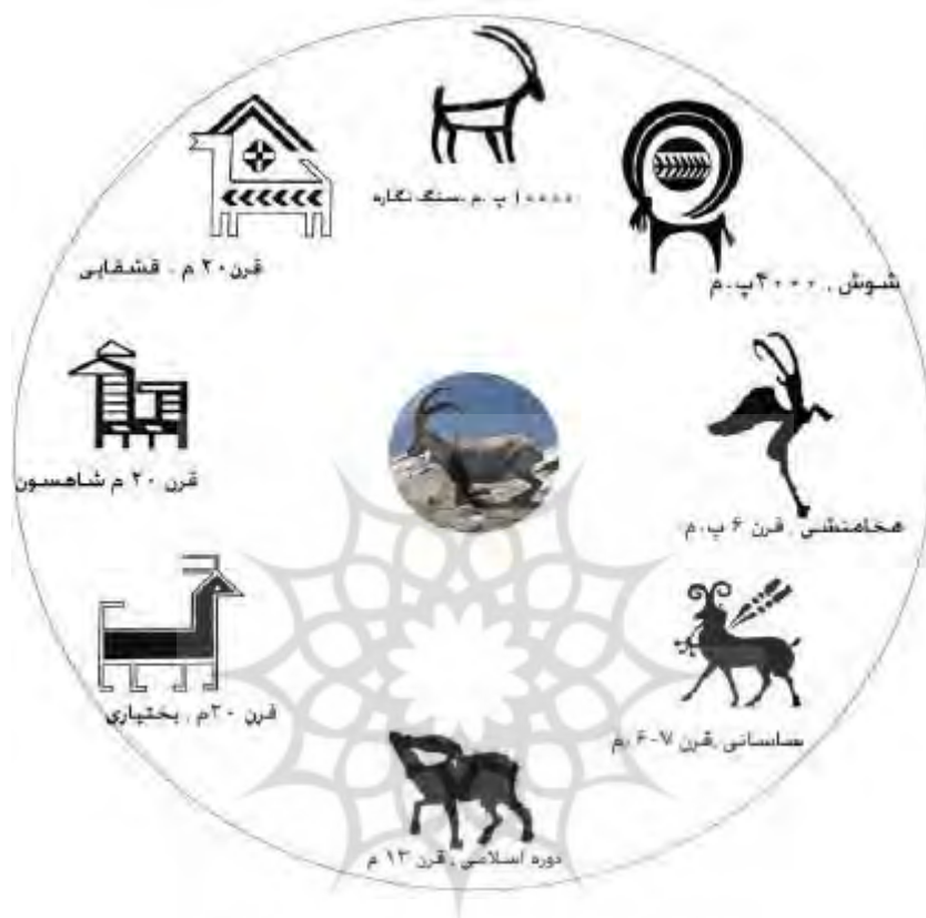
طرح ۲) مقایسه تغییرات شکل طبیعی بز کوهی و اشکال آن در هنر از دوران آغاز تاریخ تا گلیم عشایر (افضل طوسی، ۱۳۹۱: ۶۴)