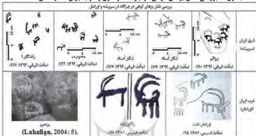
جدول ۲) بررسی نقش بزهای کوهی در چراگاه در شرق و غرب ایران (نگارندگان، ۱۳۹۴)