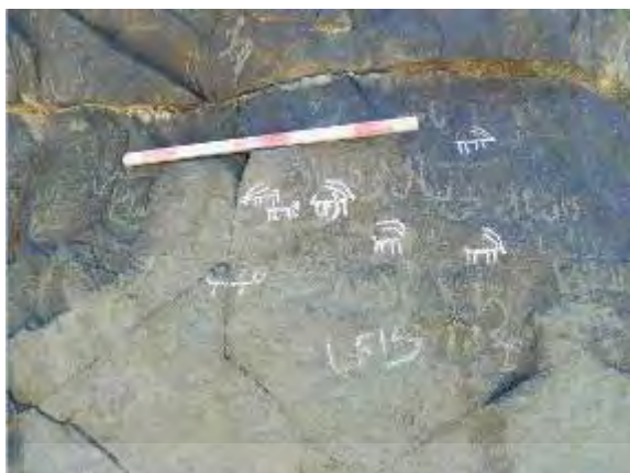
تصویر ۸) نقش بزهای کوهی در چراگاه در سنگ نگاره ماخونیک (قربانی، ۱۳۹۲: ۱۲۲)