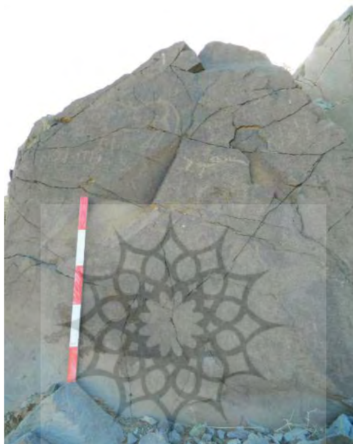
تصویر ۱۲) نقش بزهای کوهی همراه با حیوانات و نقوشی نامعلوم در سنگ نگاره تنگل اُستاد