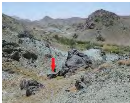
تصویر ۳) نمایی از صخره محوطه دامدانه