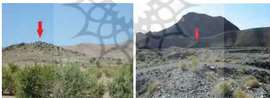
تصویر ۱) نمایی از صخره محوطه بیژانم تصویر ۲) نمایی از صخره محوطه تنگل اُستاد