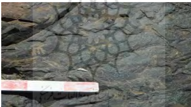
تصویر ۹) نقش بزهای کوهی در چراگاه در سنگ نگاره رامنگان ۱ (قربانی، ۱۳۹۲: ۱۲۶)