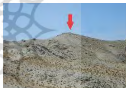
تصویر ۵) نمایی از صخره محوطه رامنگان ۱