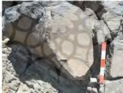
تصویر ۷) نقش بزهای کوهی در چراگاه در سنگ نگاره بیژانم (قربانی، ۱۳۹۲: ۱۱۰)

در نگاره‌های جانوری این دو حوزه، تنوع چشمگیری در سبک کار و موضوعات نگاره وجود دارد. یکی از این موضوعات نقش بزهای کوهی در چراگاه است (تصاویر ۷، ۸ و ۹). نقش بزهای کوهی در چراگاه در هشت محوطه کشف شده است. هنرمند برای ایجاد هر طرح، قاعده معینی را در نظر گرفته و به دلخواه و میل باطنی خود آن را نقش نموده است. نقش‌ها به صورت گروهی به نمایش درآمده‌اند که شاید نشانه‌ای برای نشان دادن گله و رمه‌ای در چراگاه باشد. نقش بزها در اکثر محوطه‌ها بسیار ساده و به دور از هرگونه تزیینی نقر شده‌اند. بر پشت بعضی از نقوش حیوانی (بز)، زائده‌ای نقر شده است. در برخی از نقوش می‌توان دید که به دلیل گذشت زمان و آسیب دیدگی سنگ، نقوش نیز آسیب دیده است (جدول ۲). در خصوص روش نقر، تمام نقوش به سبک پتروگلیف و کنده کاری نقر شده است.