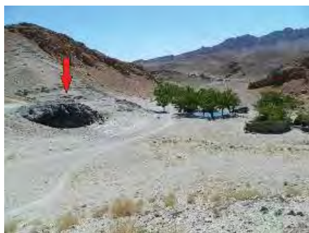
تصویر ۴) نمایی از صخره محوطه ماخونیک