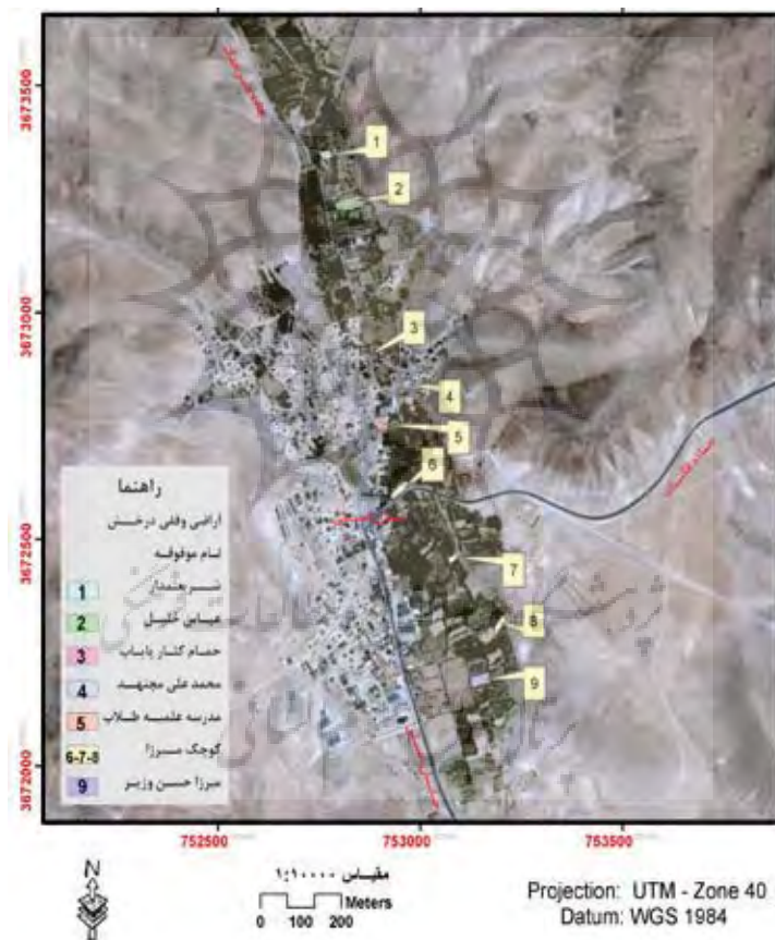
شکل ۳) موقعیت اراضی وقفی در بخش

موقوفه که از معتمدین روستا و بیش از هفتاد سال سن داشتند اظهار می‌کردند که با فوت ما دیگر ورثه اطلاع چندان دقیقی از موقعیت مکانی اراضی موقوفه که در کشتان روستا پراکنده است ندارند و ممکن است در آینده در صورت تهیه نشدن نقشه اراضی، بخش‌هایی از اراضی از مالکیت وقفی خارج گردد. این مسأله نگرانی اغلب مستأجرین کهن‌سال و میان‌سال است که با اجرای این طرح، تا حد زیادی می‌توان بر این مشکل فائق آمد.