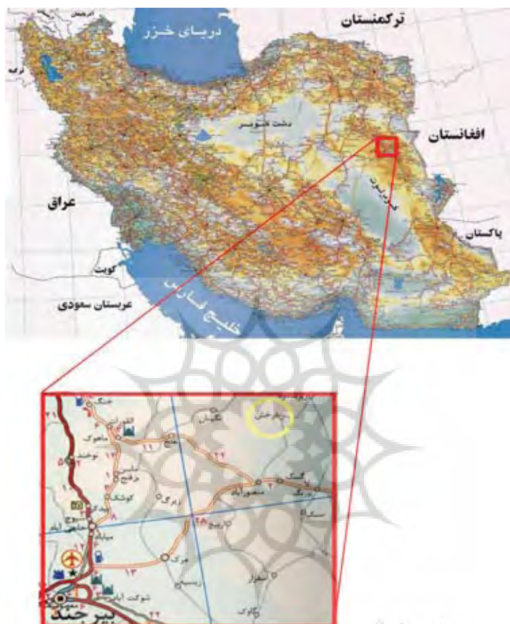
شکل (۱) موقعیت محدوده‌ی مورد بررسی نسبت به شهر بیرجند

مواد و داده‌های مورد استفاده در این پژوهش شامل موارد زیر می باشد: نقشه‌های توپوگرافی منطقه با مقیاس ۱/۲۵۰۰۰ اخذ شده از سازمان نقشه‌برداری کشور اطلس جاده‌های ایران با مقیاس ۱/۱۰۰۰۰۰۰ برای تهیه نقشه موقعیت محدوده مورد بررسی