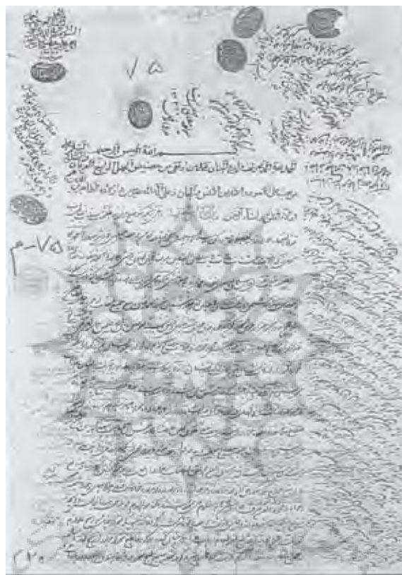
تصویر وقفنامه آقا محمدعلی مجتهد مربوط به سال ۱۲۸۸ هجری قمری مربوط به موقوفه فضل آباد