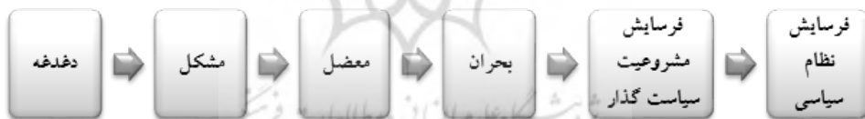
شکل ۱. چرخه مشکل

سیاست‌ها معین کرد (هیل و وارون، ۲۰۱۴). "بازبینی" مرحله چهارم در فرآیند سیاست‌گذاری است. این مرحله، دانش مرتبط با سیاستی را در زمینه نتایج سیاست‌گذاری‌های اقتباس‌شده پیشین، در اختیار سیاست‌گذاران قرار خواهد داد و بدین ترتیب، به آنها در مرحله اجرای سیاست کمک خواهد کرد. بسیاری از سازمان‌ها به‌طور مرتب، نتایج و تأثیرات سیاست‌ها را بازبینی و نظارت می‌کنند که این بازبینی به‌وسیله شاخص‌های سیاستی مختلفی در زمینه‌های سلامتی، آموزش، مسکن، رفاه، جرم و علم و فناوری صورت می‌گیرد. به کمک بازبینی می‌توان به میزان پیروی پی برد، پیامدهای ناخواسته سیاست‌گذاری‌ها و برنامه‌ریزی‌ها را آشکار ساخت، موانع و محدودصرهای اجرایی را تشخیص داد و منبع مسئول انحراف سیاست‌ها را معین کرد (طباطباییان، راد و شجاعی، ۱۳۸۸). آخرین مرحله در سیاست‌گذاری، "ارزیابی" است. ارزیابی، دانش مرتبط با سیاستی را در پیش‌روی سیاست‌گذاران قرار می‌دهد که در زمینه فاصله نتایج سیاست‌های موردانتظار واقعی است و بدین‌سان به آنها در مرحله برآورد سیاست فرآیند سیاست‌گذاری یاری خواهد رساند. با استفاده از ارزیابی می‌توان علاوه بر تعیین میزان کاهش مشکلات، ارزش‌های موجود در یک سیاست‌گذاری را نیز نقد و بررسی کرد (عبدالحسین زاده، ثنایی و ذوالفقارزاده، ۱۳۹۶). فرآیند سیاست‌گذاری متأثر از رویکرد مرحله‌ای است. مراحل فرآیند سیاست‌گذاری عمومی متنوع و گسترده است. این الگوها اکثراً روش‌های ایده‌آل است.