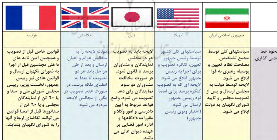
جدول ۱. مقایسه تطبیقی خط‌مشی‌گذاری در کشورها