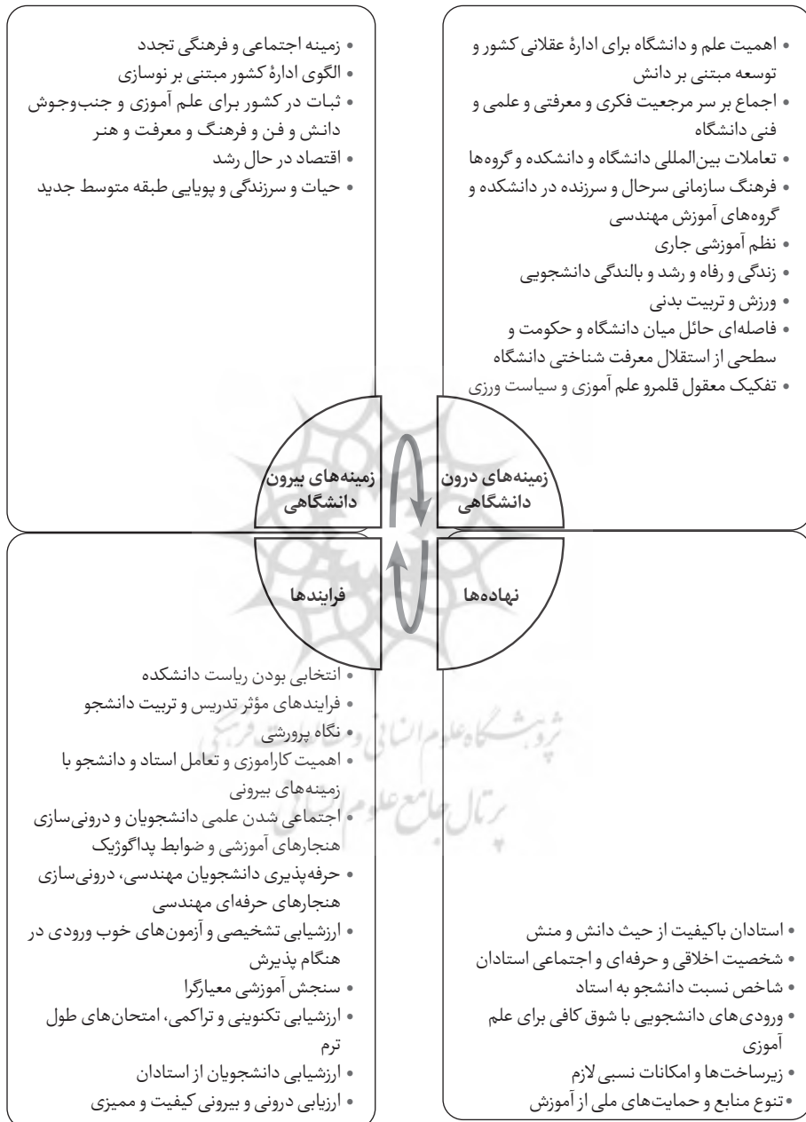
نمودار ۱. مدل به‌دست‌آمده از توضیح ظهور کیفیت آموزش مهندسی

مجموع این نتایج در نمودار ۱ زیر بازنمایی شده است: